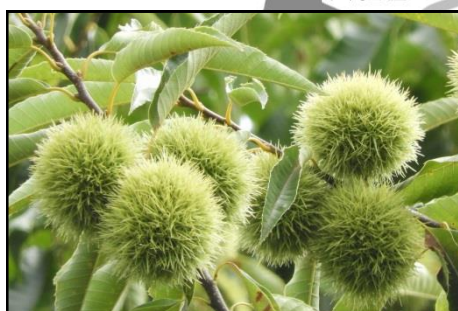
クリの若い実 (ブナ科)