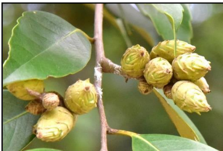
スダジイの若い実 (ブナ科)