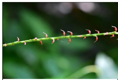
ミズヒキ (タデ科) 名前の由来は祝儀袋などに使う「水引」に似ていることによります。