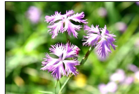
カワラナデシコ (ナデシコ科) 秋の七草の一つです。