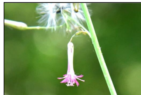
ムラサキニガナ (キク科)