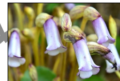
ナンバンギセル (ハマウツボ科) イネ科植物 (三木山ではススキ) の根に寄生します。