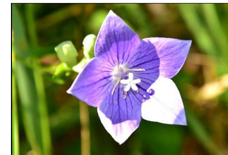
キキョウ (キキョウ科) 秋の七草の一つです。