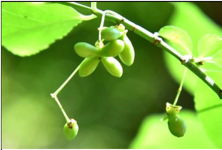
コマユミの若い実 (ニシキギ科) 秋になり成熟すると実は赤くなります。翼ができないニシキギです。