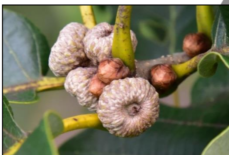
ナラガシワの若い実 (ブナ科)