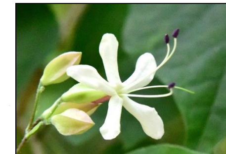
クサギ (シノ科) 名前が微妙ですが、大変美しい花が咲き、実もきれいです。