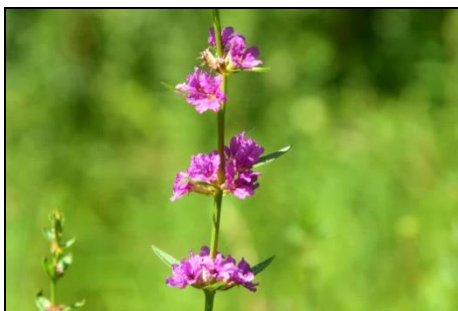
ミソハギ (ミソハギ科)