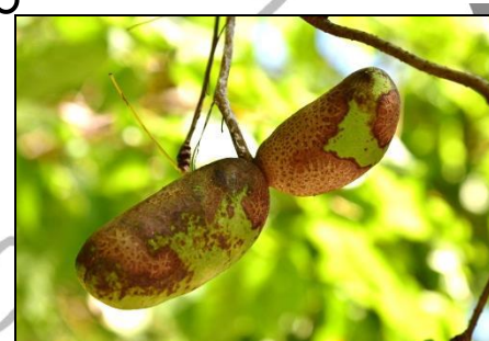
ミツバアケビの若い実 (アケビ科) 大分熟してきました。