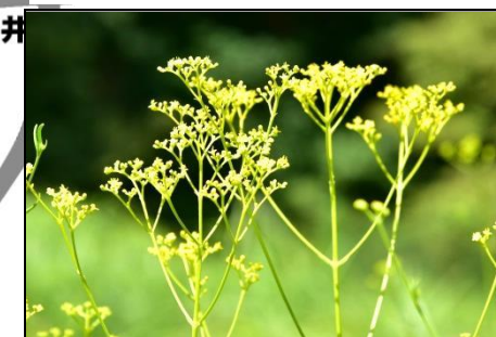
オミナエシ (オミナエシ科) 秋の七草の一つです。