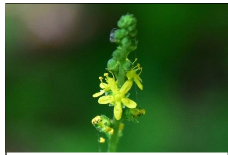
キンミズヒキ (バラ科) 種は服などによくくっつきます。