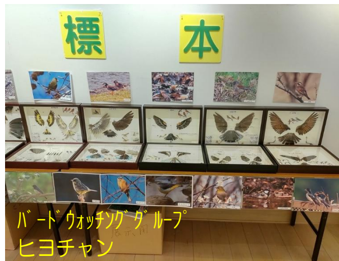
バードウォッチンググループ ヒヨちゃん