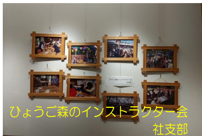
ひょうご森のインストラクター会 社支部