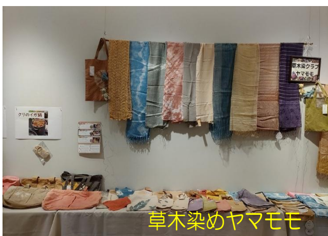
草木染めヤマモモ