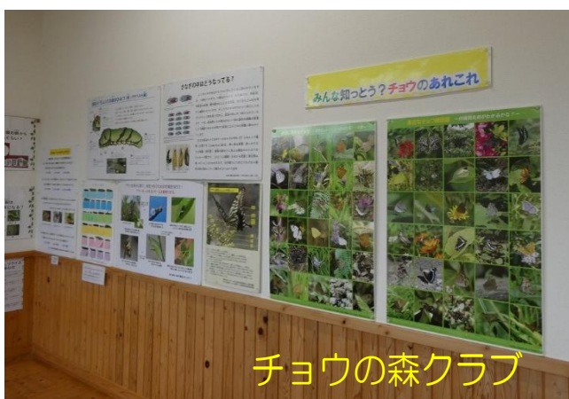
チョウの森クラブ