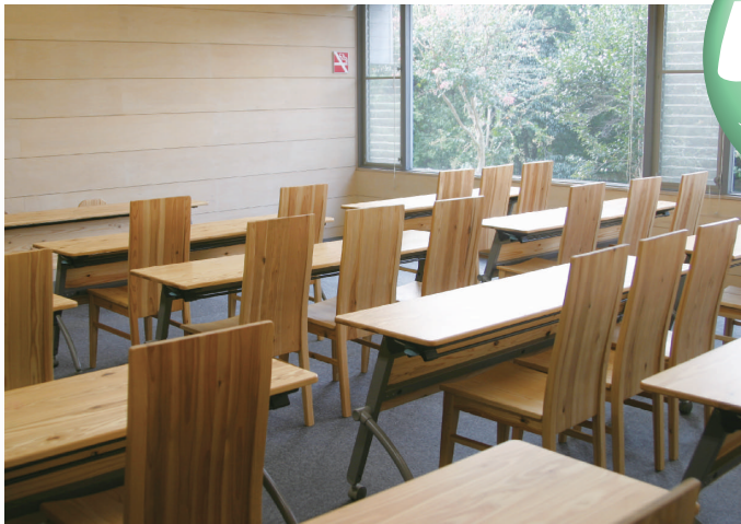
定員35名の全てが木でできた会議室

木の部屋、木の机、木のイス 全てが温かみのある「木」で作られた部屋、 親しい友との語らいや打合せ、ちょっとした会議、こんな集まりに最適の会議室。 厳しくもやさしい有意義な時間をお試しください。