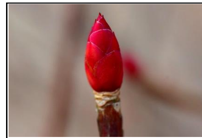
ドウダンツツジの頂芽 (ツツジ科)