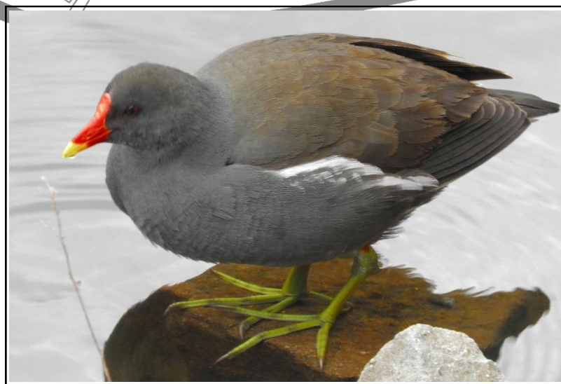
バン (足の構造) (クイナ科)