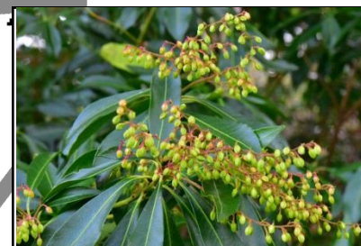
アセビの花芽 (ツツジ科)