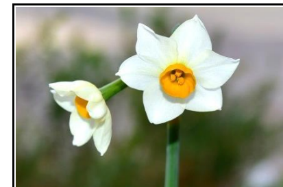
スイセン (ヒガンバナ科)