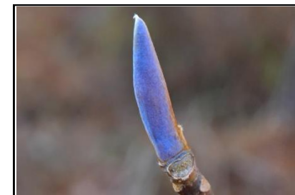
ホオノキの頂芽 (モクレン科)