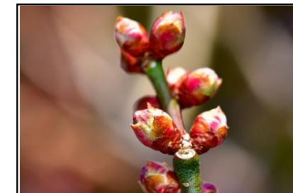
ウメの花芽 (バラ科)