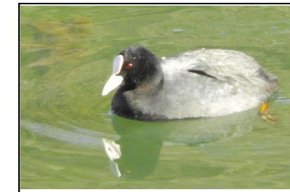
オオバン (クイナ科)