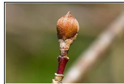
サンシュユの花芽 (ミズキ科)