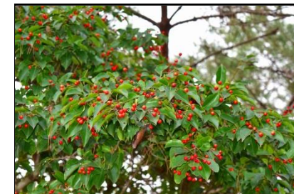
ソヨゴの実 (モチノキ科)