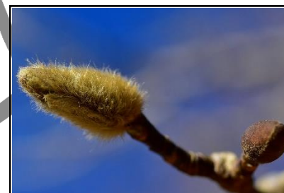
コブシの花芽 (モクレン科)