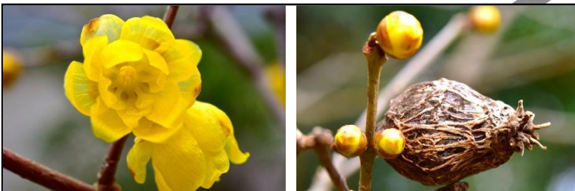
ソシンロウバイの花 (ロウバイ科)