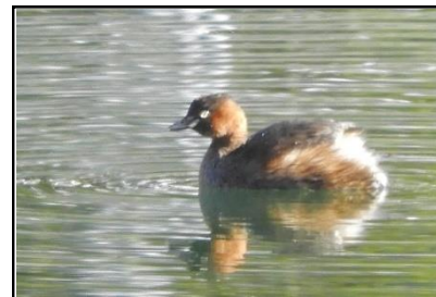
カイツブリ (カイツブリ科)