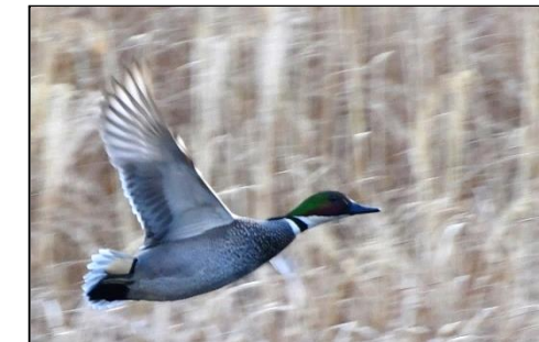
ヨシガモ (雄) (カモ科) 中池と下池でよく見かけます。