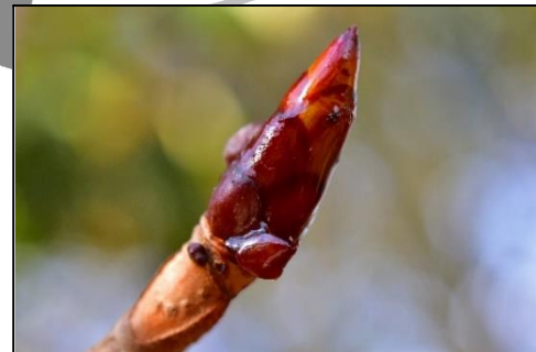
トチノキの頂芽 (ムクロジ科) 芽鱗が樹脂でべとべととしています。