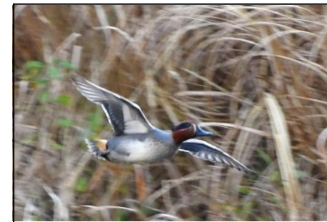
コガモ (雄) (カモ科) 下池と上池でよく見かけます。