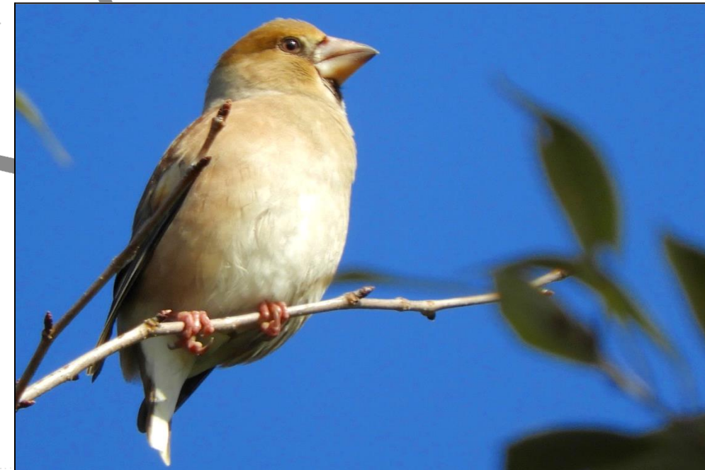
シメ (雌) (アトリ科) 太いくちばしをしています。