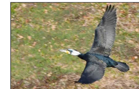
カワウ (ウ科) 中池、下池、上池に獲物を ねらってたまに来ています。