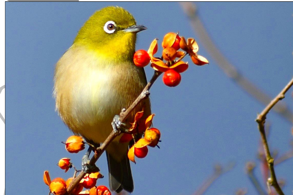
メジロ (メジロ科) ツルウメモドキの実やサザンカの花によく来ています。