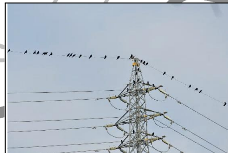
カラスの集団 (カラス科) 高圧線の鉄塔に多くの カラスが集まっています。