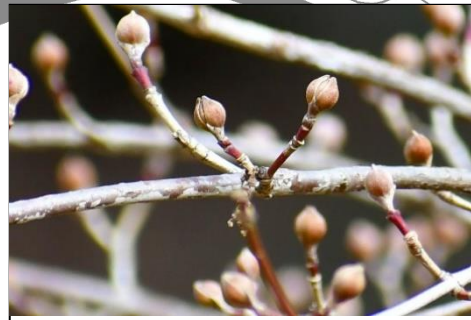
サンシュユの花芽 (ミズキ科) もうすぐ黄色い花を咲かせます。