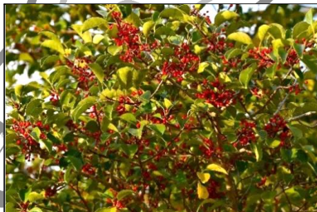
クロガネモチの実 (雌木) (モチノキ科) まだ赤い実が多く残っています。