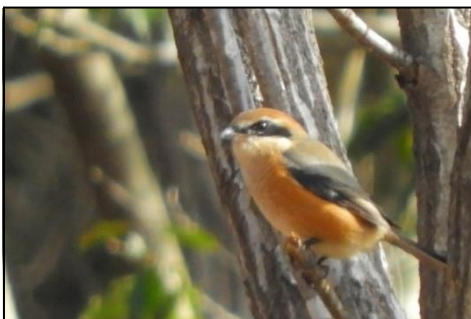
モズ (雄) (モズ科) 「モズのはやにえ」を作ります。