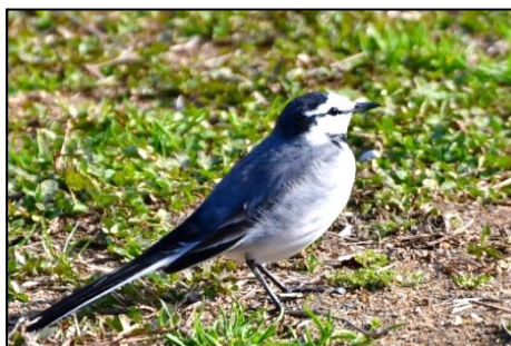
ハクセキレイ (セキレイ科) 白っぽい顔をしたセキレイ です。