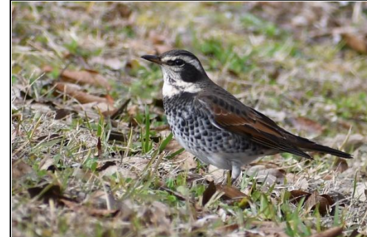
ツグミ (ヒタキ科) 今年も帰ってきました。