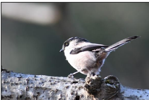
エナガ (エナガ科) メジロと同じ集団で 行動しています。