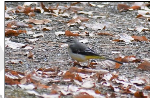
キセキレイ (セキレイ科) なかなか姿を 見せません。