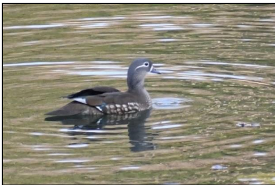
オシドリ (カモ科)の雌 中池、奥池間を行き来 しています。