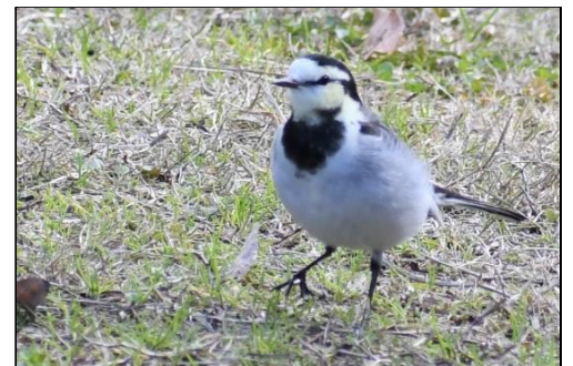
ハクセキレイ (セキレイ科) 三木山では、セグロセキレイ よりも見る機会が多いです。