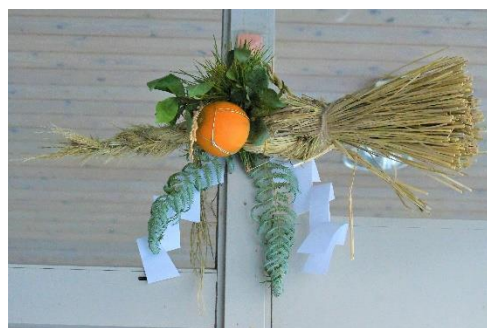
門松としめ縄 三木山森林公園 自家製の門松と しめ縄です。