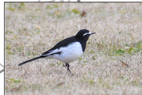
セグロセキレイ (セキレイ科) 日本の固有種とされています。