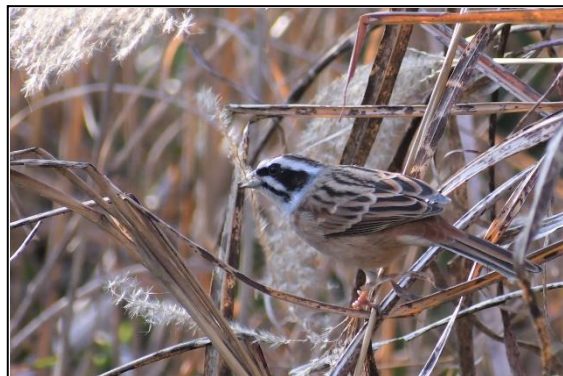
ホオジロ (ホオジロ科) ススキの穂をかじって います。