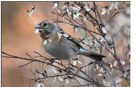
アトリ (アトリ科) イロハモミジの実を 食べています。