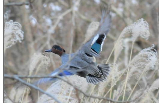
コガモの雄 (カモ科)