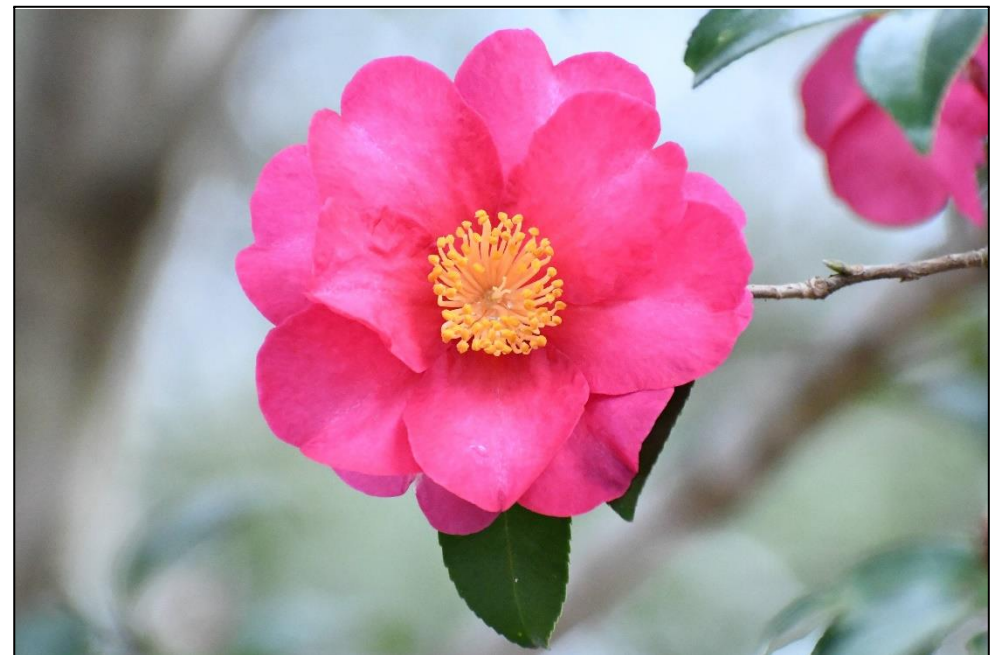
サザンカ (ツバキ科) サザンカが満開です。