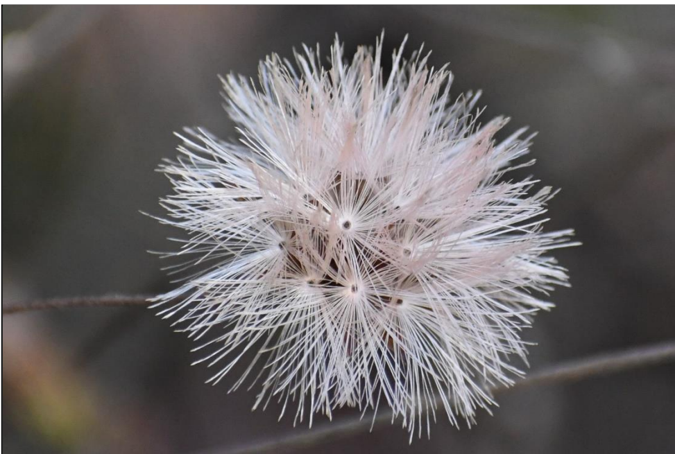
コウヤボウキ (キク科) の実