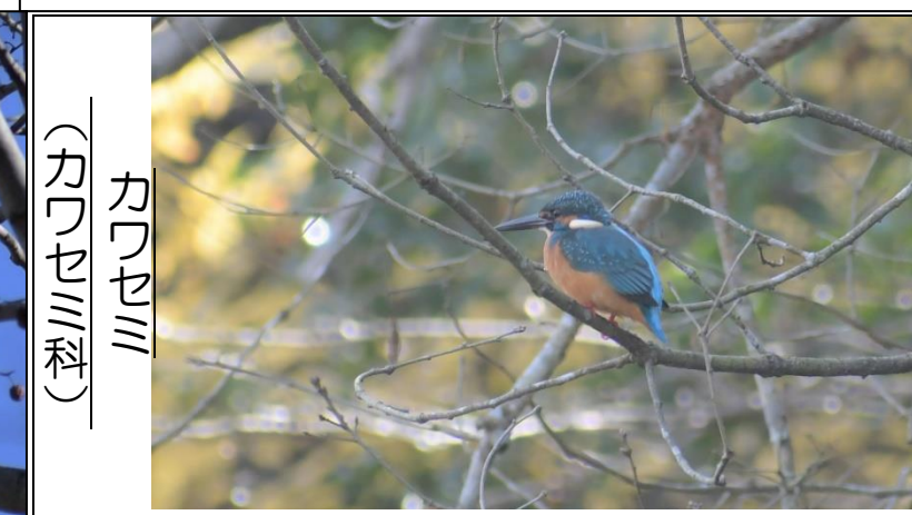
(カワセミ科) カワセミ