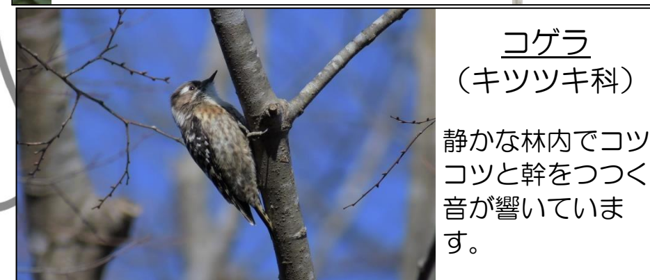
コゲラ (キツツキ科)