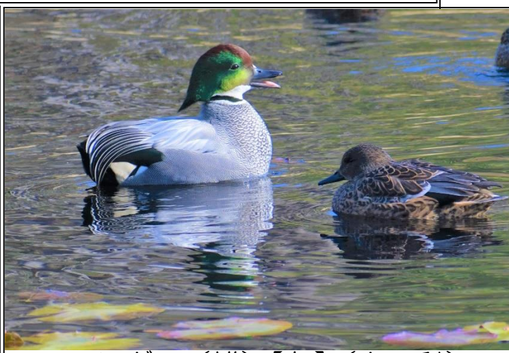
ヨシガモ (雄)【左】 (カモ科)