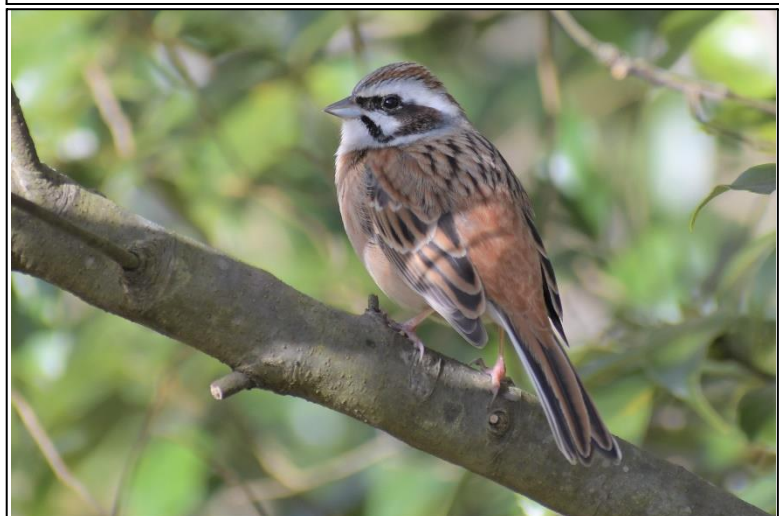
ホオジロ (雌) (ホオジロ科)