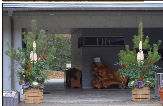
三木山自家製の門松 三木山でとれた材料を使って職員が作った門松です。