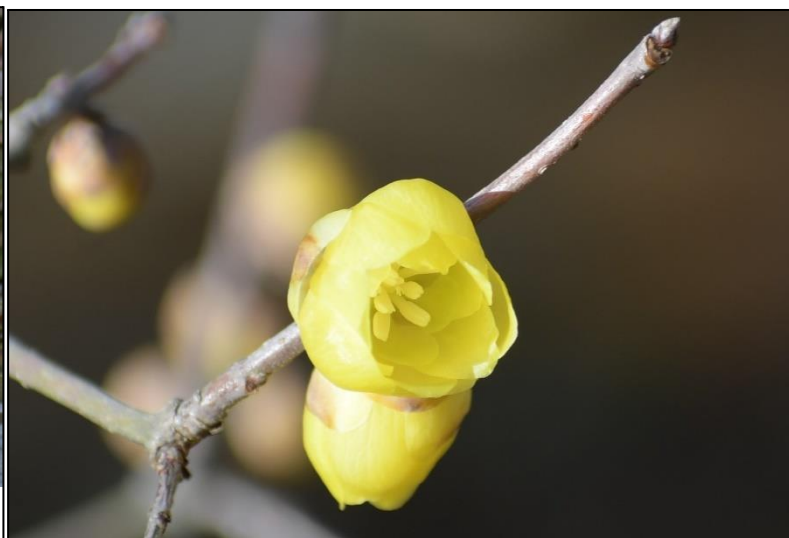
ソシンロウバイ (ロウバイ科)