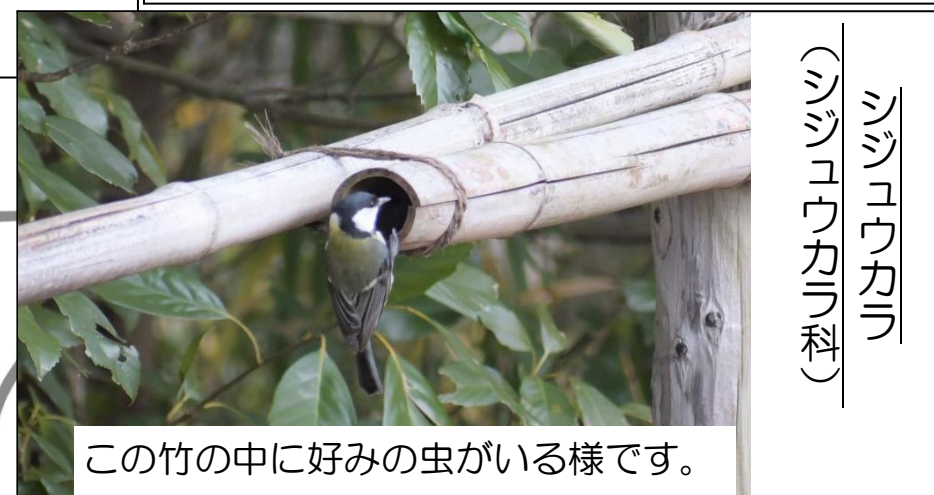
(シジュウカラ科) シジュウカラ