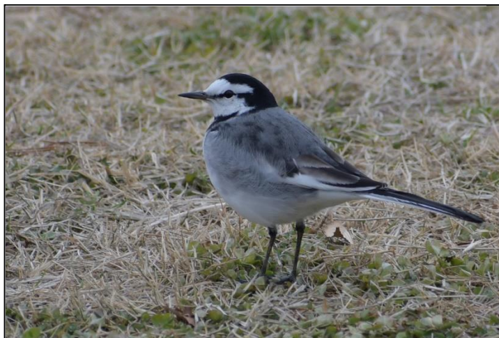
ハクセキレイ (セキレイ科)

ハクセキレイ (頬が白い) は芝生の上に、キセキレイは流れにすることが多いです。