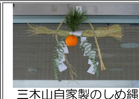
三木山自家製のしめ縄 昨年の12月18日のしめ縄づくりのイベントで作り方を習った職員による自家製のしめ縄です。