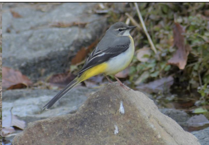
キセキレイ (セキレイ科)

ハクセキレイ (頬が白い) は芝生の上に、キセキレイは流れにすることが多いです。