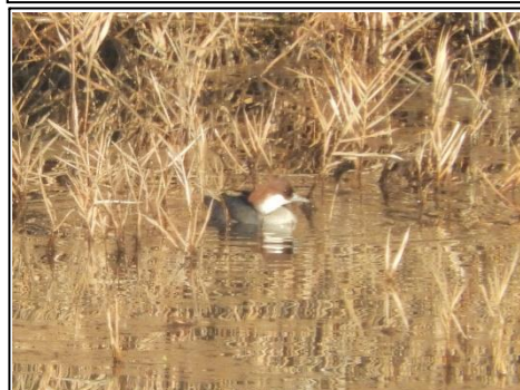
ミコアイサ (雌) (カモ科)