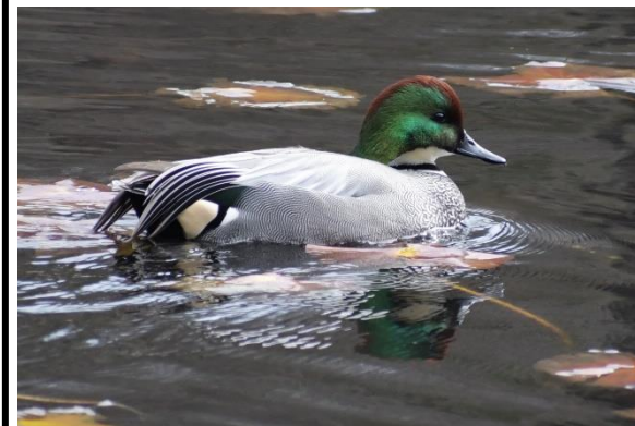
ヨシガモの雄 (カモ科)