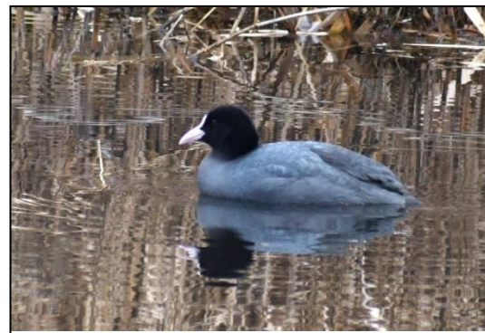
オオバン (クイナ科) バンとともに三木山ではお馴染みの水鳥です。