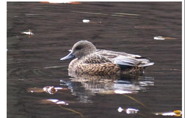
ヨシガモの雌 (カモ科)