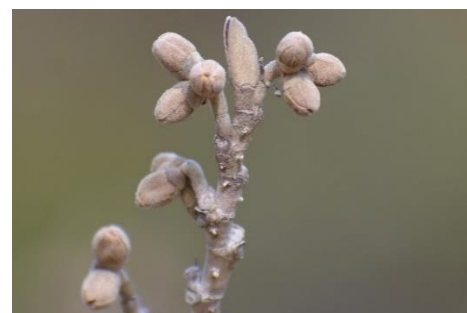
マンサクの花芽 (マンサク科) ⑤