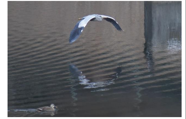
アオサギ (サギ科) ちょうど飛び立ちました。