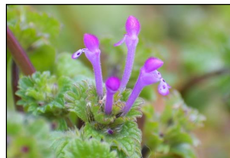
ホトケノザ (シソ科) ⑥