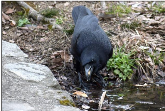
ハシブトガラス (カラス科)