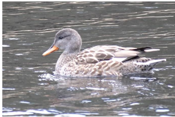
オカヨシガモの雌 (カモ科)