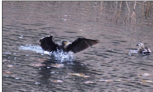
カワウの着水 (ウ科)

潜水の名人です。今シーズンはよく見かけます。他の池から移動してきて着水するところです。