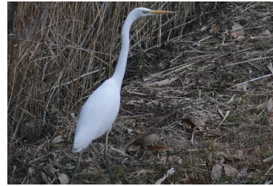
ダイサギ (サギ科) 周りで観察している人間の動きを注意深く見えています。