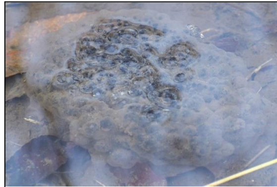
ニホンアカガエルの卵塊 (アカガエル科) ①