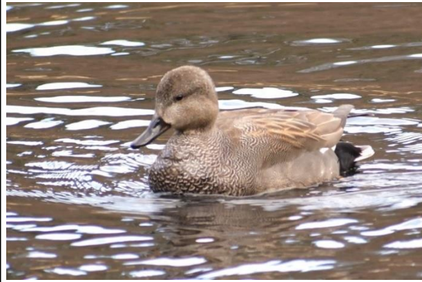
オカヨシガモの雄 (カモ科)