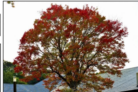
トウカエデの紅葉(ムクロジ科) きれいに紅葉しています。