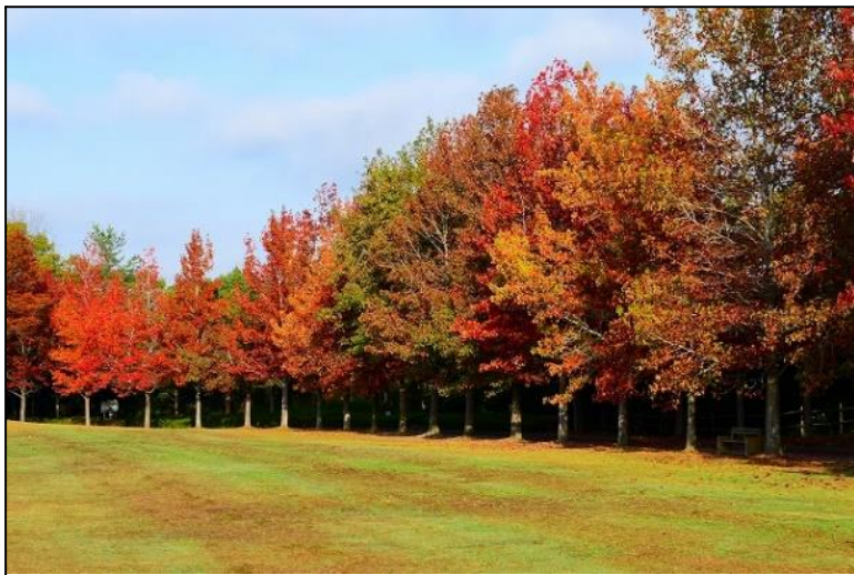
イベント広場のモミジバフウの紅葉が最盛期を迎えています。