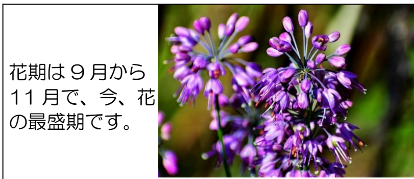
ヤマラッキョウの花(ヒガンバナ科) 花期は9月から11月で、今、花の最盛期です。