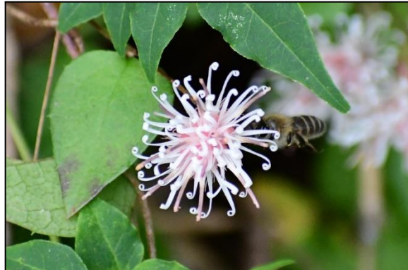
コウヤボウキの開花(キク科) 高野山でこの枝を帚(ほうき)の材料にしていたとのこと。