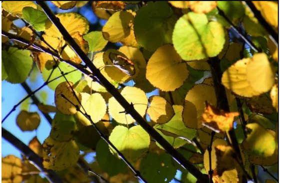
カツラの黄葉(カツラ科) 黄葉した葉は良いにおいがします。