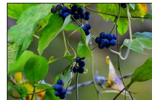
アオツツラフジの実(ツツラフジ科) 落葉つる性の木本で、青く熟した実が美しい。有毒です。