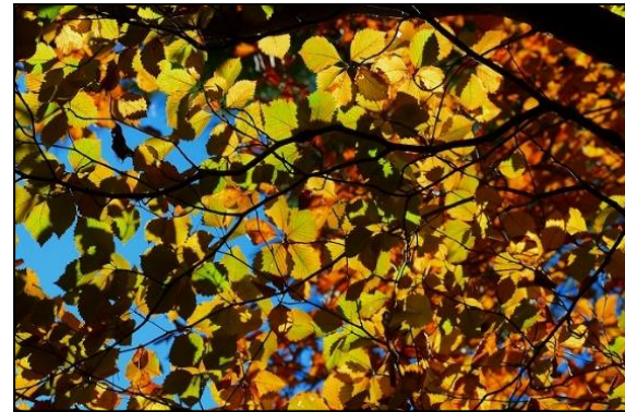
ウラジロノキの紅葉(バラ科) 紅葉しています。