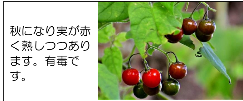
ヒヨドリジョウゴの実(ナス科) 秋になり実が赤く熟しつつあります。有毒です。