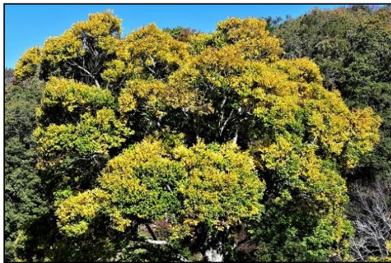
エノキの黄葉(アサ科) 今年のエノキは美しく黄葉しています。