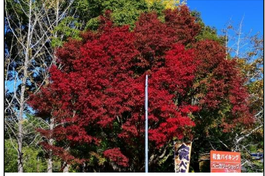
正門のイロハモミジの紅葉(ムクロジ科) 正門に紅葉の美しいイロハモミジがあります。