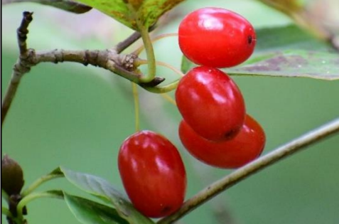
サンシュユの実(ミズキ科) 今年も美しい赤い実が付きました。