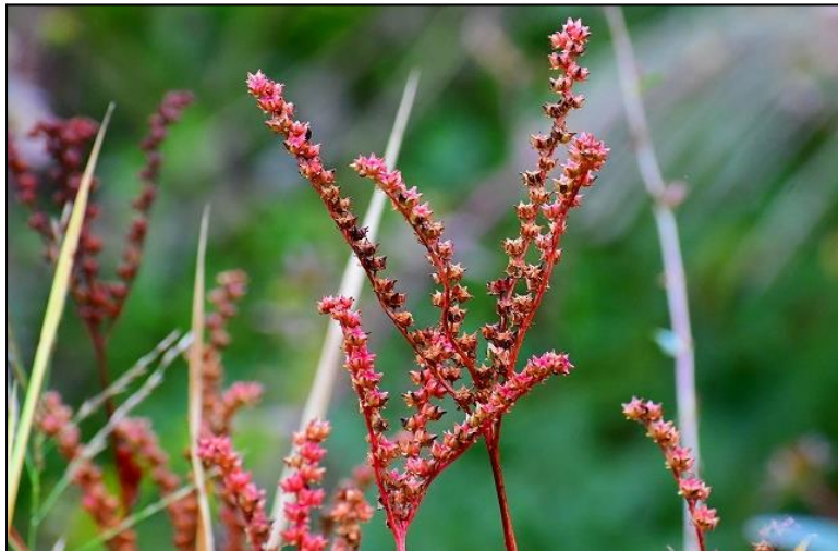
タコノアシの紅葉(タコノアシ科) 紅葉した状態が吸盤の付いたタコの足に見えることからこう呼ばれています。