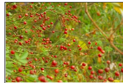
ノイバラの実 (バラ科)