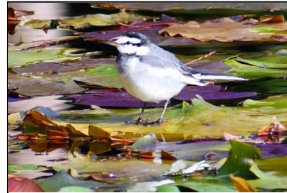
ハクセキレイ (セキレイ科)