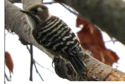
コゲラ (キツツキ科)