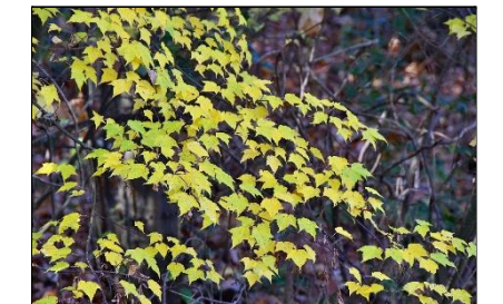
ウリカエデの黄葉 (ムクロジ科)