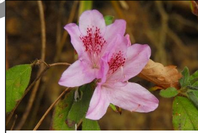
モチツツジの狂い咲き (ツツジ科)