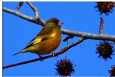
カワラヒワ (ヒタキ科)