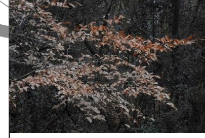
ヤマコウバシの枯れ葉 (クスノキ科)