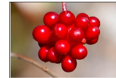
サネカズラの実 (マツササ科)