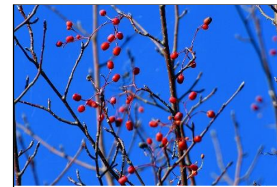
アズキナシの実 (バラ科)