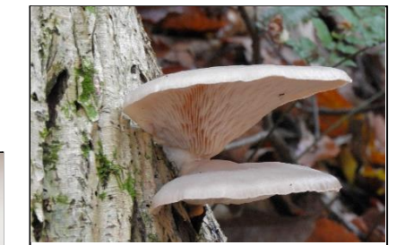
ウスヒラタケ (ヒラタケ科)

フジにウスヒラタケと思われるきのこが発生しています。発生時期は本来もっと早い時期らしいです。きのこには有毒なものがありますので、決して食べないでください。