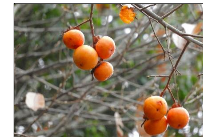
カキノキの実 (カキノキ科)