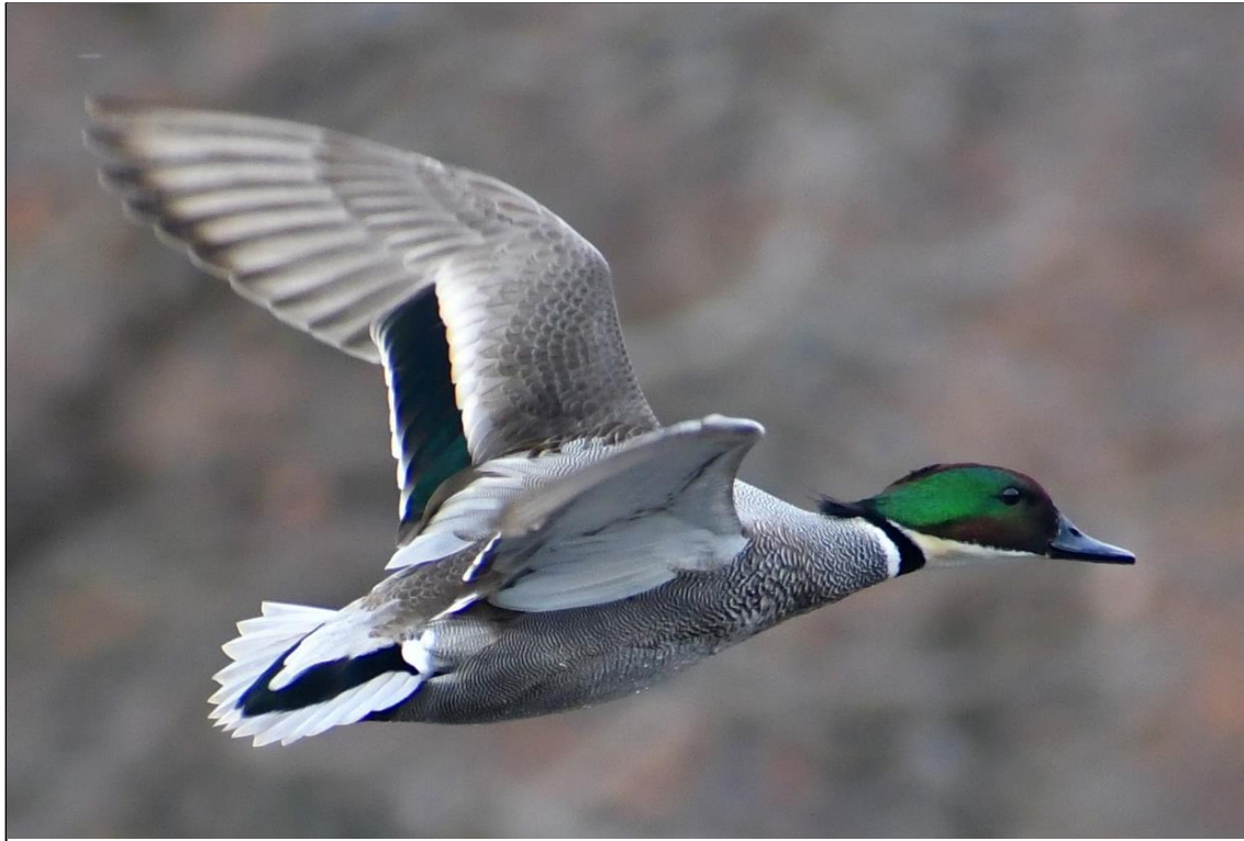
ヨシガモ (雄) (カモ科)