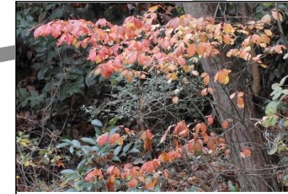
コマユミの紅葉 (ニシキギ科)