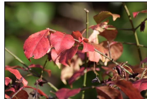
鮮やかに紅葉しています。