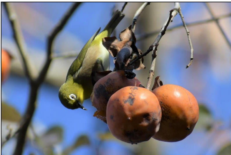
カキノキの実をつついている メジロ (メジロ科)

今年はカキノキが豊作です。メジロが美味そうにカキノキの実をつついているのを見かけます。