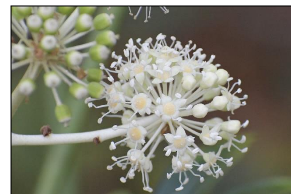
ヤシロの花 (ウロギ科)