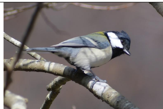
シジュウカラ (シジュウカラ科)