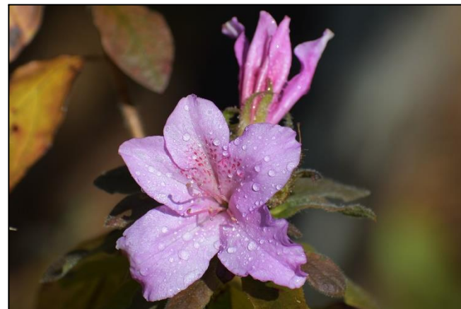
モチツツジの狂い咲き (ツツジ科)

今年はカキノキが豊作です。メジロが美味そうにカキノキの実をつついているのを見かけます。