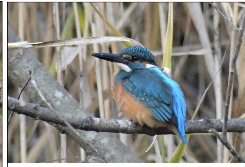
カワセミ (カワセミ科)