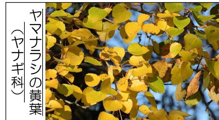
ヤマナラシの黄葉 (ヤナギ科)