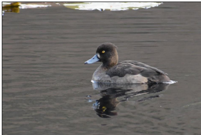
キンクロハジロ (カモ科)