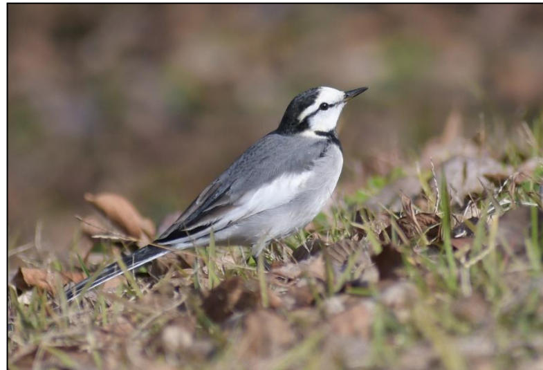
ハクセキレイ (セキレイ科)