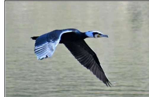
カワウ (飛翔) (ウ科) 中池から飛び立ち、下池方面に行きました。