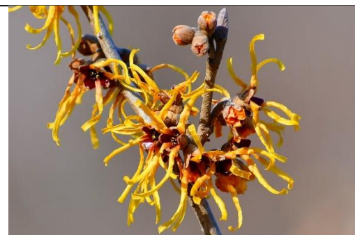
マンサクとシナマンサク (マンサク科) まずマンサクが咲き、続いてシナマンサクが満開です。