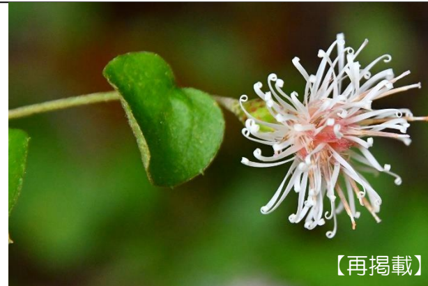
コウヤボウキの果実と花 (キク科) 令和2年11月上旬で花を紹介したコウヤボウキ (写真右側) にタンポポの様な実 (写真左側) がついています。