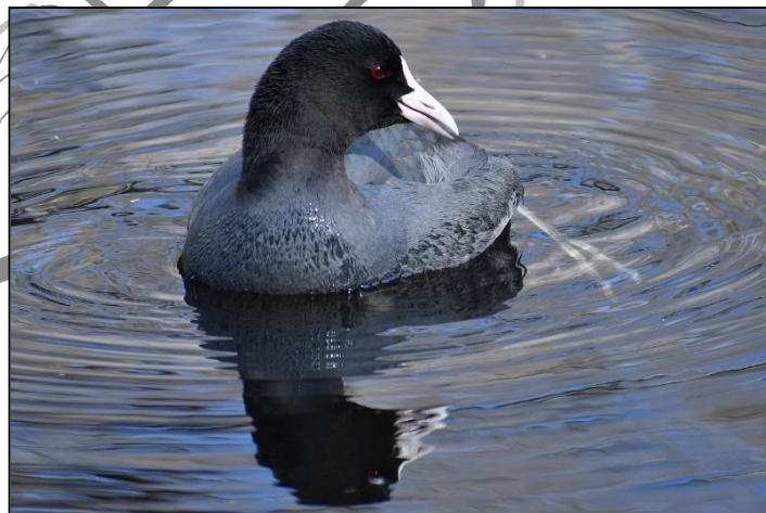
オオバン (クイナ科) 最近、下池によくいます。