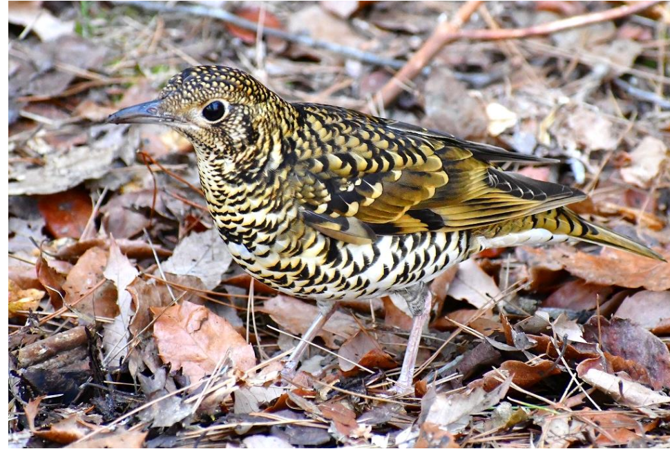
どんぐり谷で足元にいました。