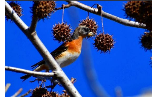
モミジバフウの実とアトリ (アトリ科) イベント広場のモミジバフウに群がっていました。