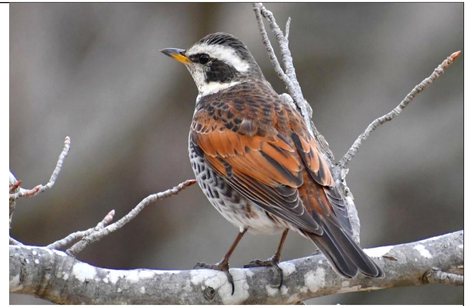
イベント広場横の樹上にいました。