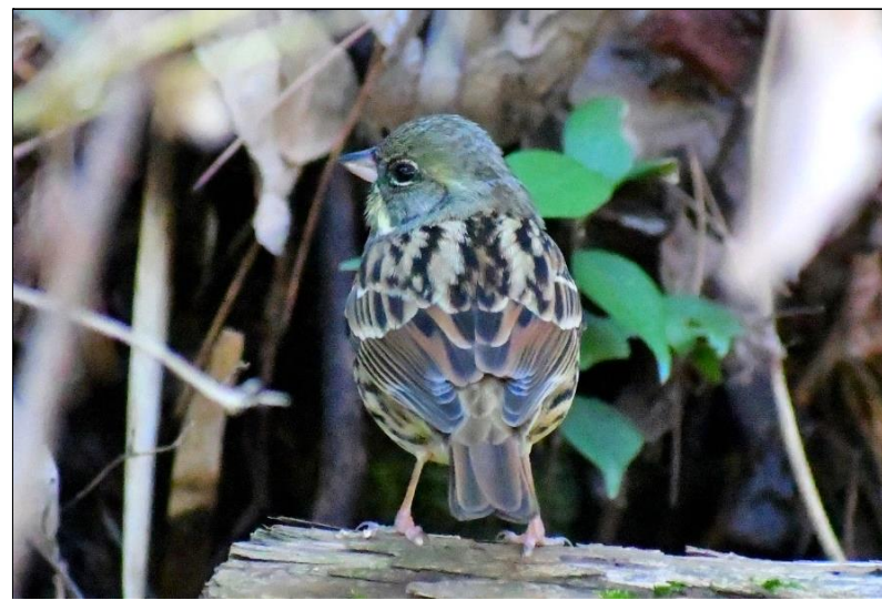
アオジ (ホオジロ科) 連絡道脇の樹林にいました。