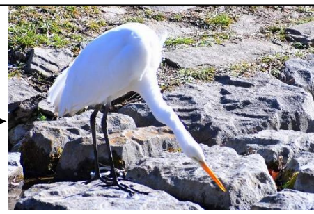
ダイサギ (サギ科) 獲物に向かって長い首が伸びます。