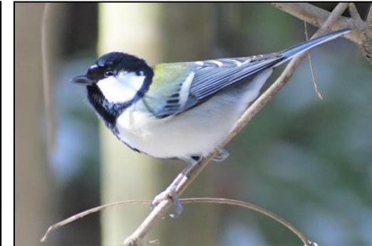
シジュウカラ (シジュウカラ科)