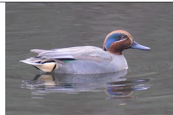
コガモ (雄) (カモ科)