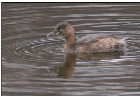
カイツブリ (カイツブリ科)