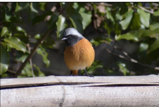
ジョウビタキ (雄) (ヒタキ科)