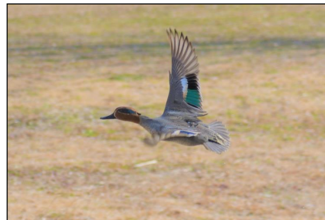
飛翔中のコガモ (雄) (カモ科)