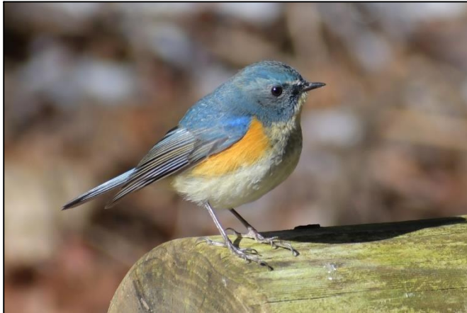
ルリビタキ (雄) (ヒタキ科)