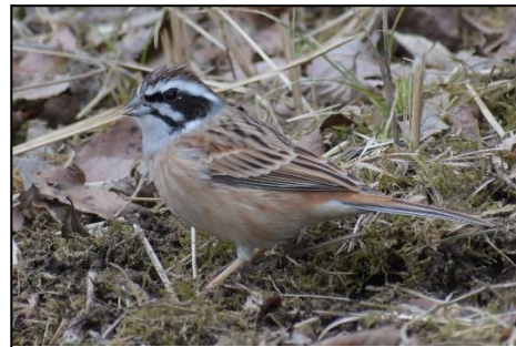
ホオジロ (ホオジロ科)