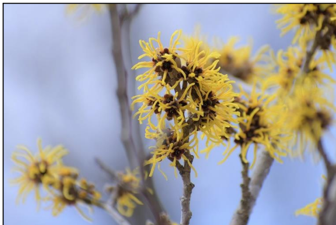
マンサクが満開です (マンサク科)