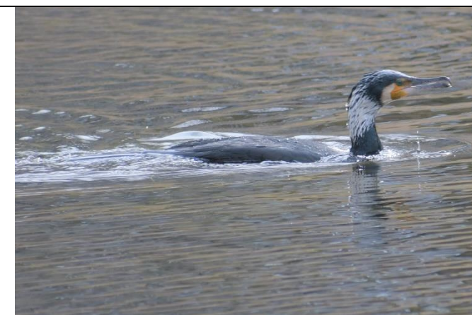
カワウでした (ウ科)