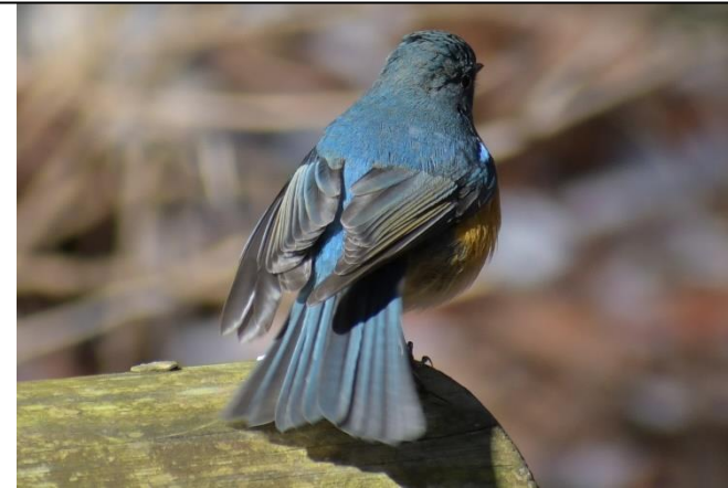
ルリビタキ (雄) の 瑠璃 (るり) 色の背中