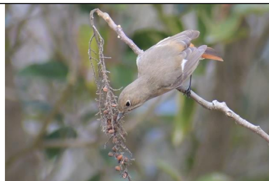
ジョウビタキ (雌) (ヒタキ科)