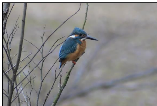
カワセミ (カワセミ科)