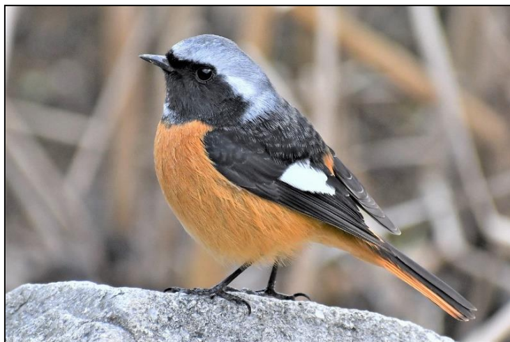
ジョウビタキの雄 (ヒタキ科)

額 (ひたい) が出っぱっておらず、嘴 (くちばし) にかけてなだらかに見えます。また、鳴き声が濁って聞こえます。