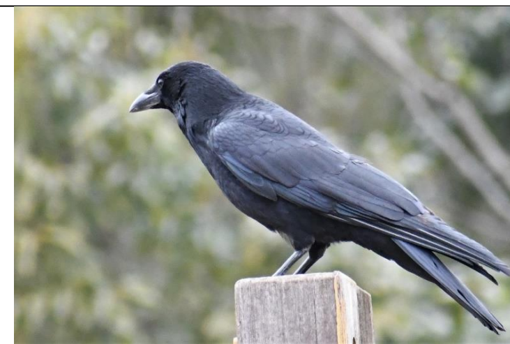
ハシボソガラス (カラス科)

額 (ひたい) が出っぱっておらず、嘴 (くちばし) にかけてなだらかに見えます。また、鳴き声が濁って聞こえます。