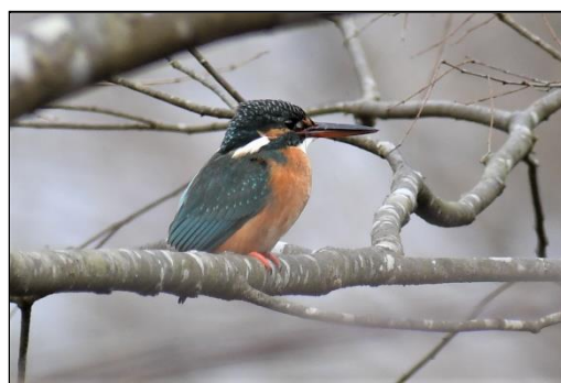
カワセミ (カワセミ科)