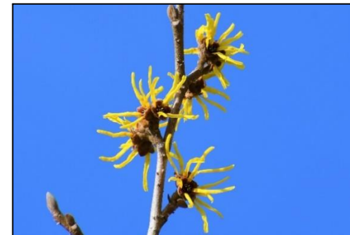
マンサク (マンサク科)