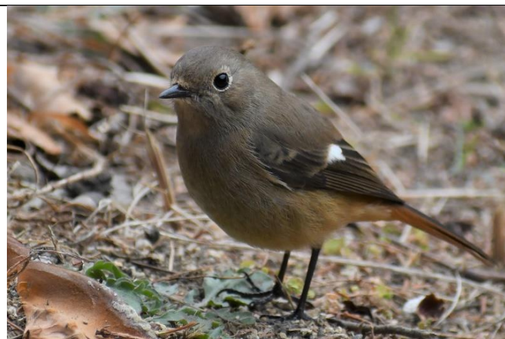
ジョウビタキの雌 (ヒタキ科)

冬鳥で現在園内でよく見かけますが、暖かくなると居なくなるので、今のうちに観察しておいてください。