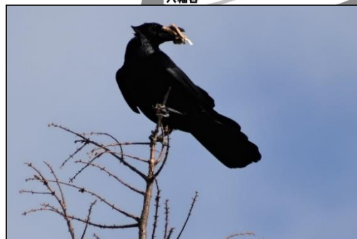
パンをゲットしたハシブトガラス (カラス科)

若い雄と雌の判別が難しいそうです。専門家によると、この写真は若い雄 (First winter) とのことです。