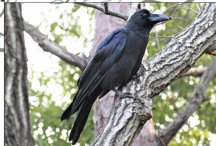
ハシブトガラス (カラス科)