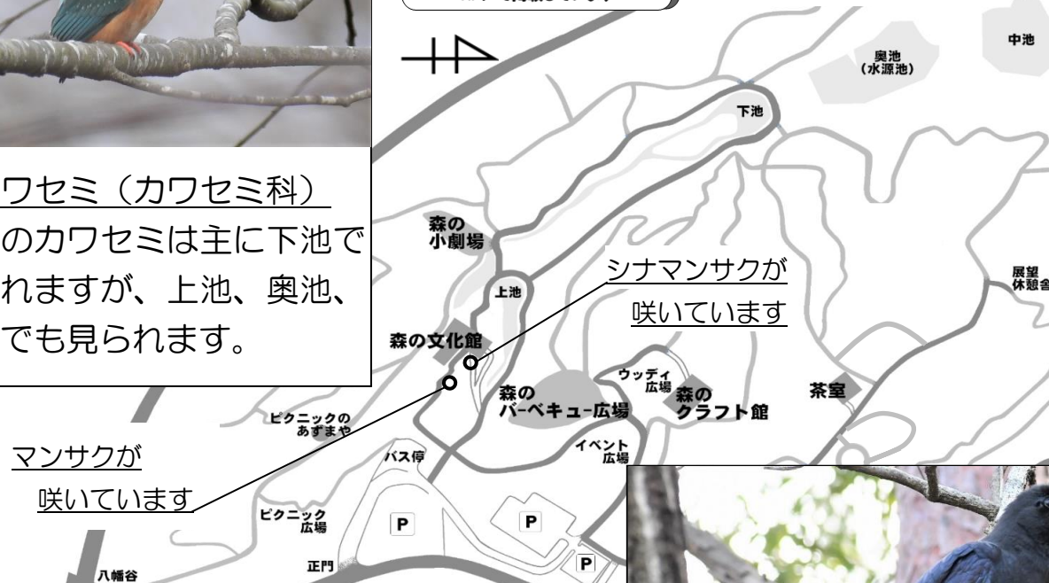
シナマンサク (マンサク科)