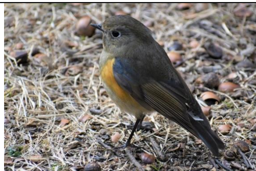
ルリビタキの雄 (First winter) (ヒタキ科)

若い雄と雌の判別が難しいそうです。専門家によると、この写真は若い雄 (First winter) とのことです。