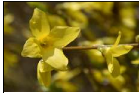
レンギョウ (モクセイ科)