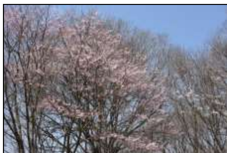
エドヒガン (バラ科) 下池の横でも、エドヒガンが咲いています。