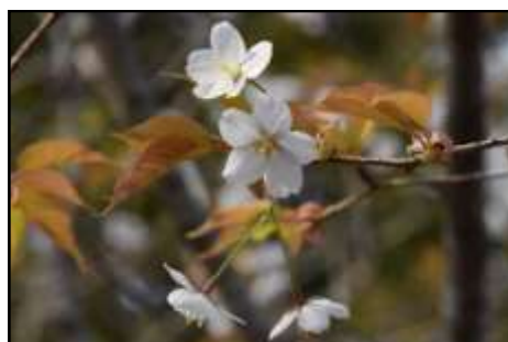
ヤマザクラ (バラ科) 香りの道で、花と葉が同時に見られるヤマザクラが清楚な花を付け始めました。