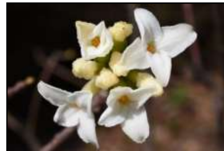
ジンチョウゲ (ジンチョウゲ科) 良い香りがします。