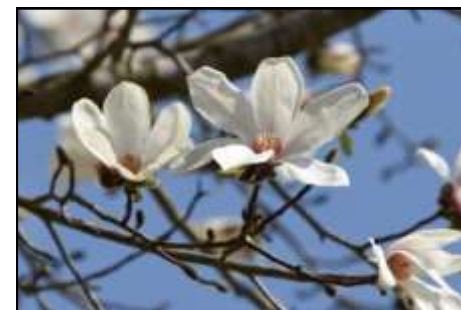
コブシ (モクレン科)