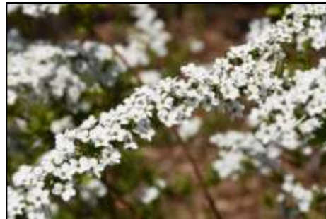
ユキヤナギ (バラ科)