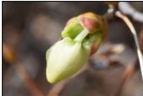
ドウダンツツジ (ツツジ科) つぼみがふくらみ始めています。