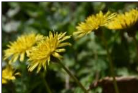
カンサイタンポポ (キク科) 総苞外片が反り返りません。