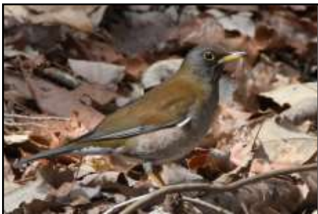
シロハラ (ツグミ科) 暖かくなってきましたが、三木山ではまだ見かけます。