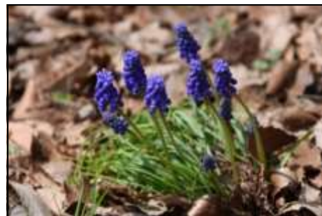
ムスカリ (キジカクシ科)