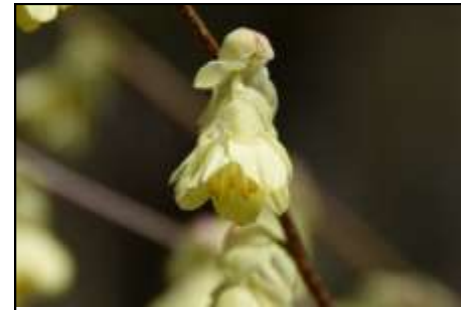
ヒュウガミズキ (マンサク科)