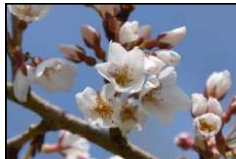
エドヒガン (樽見の大桜のクローン) (バラ科) NPO 法人ひょうご森の倶楽部創立 20 周年記念植樹