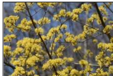
サンシュユ (ミズキ科) 先シーズンはあまり咲きませんでした、今シーズンは満開です。