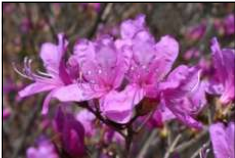
コバノミツバツツジ (ツツジ科) 気の早い木から咲き始めています。