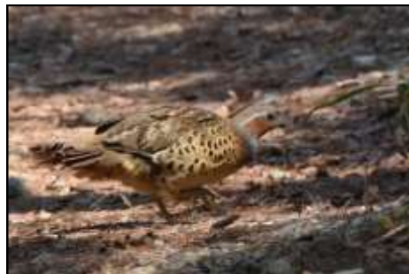
コジュケイ (キジ科) 最近見なかった「ちょっと来い！」と鳴くコジュケイがまた居ました。