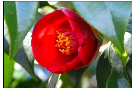
ヤブツバキ (ツバキ科)