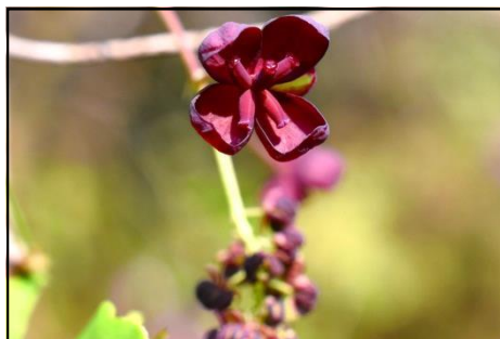
ミツバアケビの雌花と雄花 (アケビ科) 今年は花が多く、秋の実が楽しみ。 上方の大きいものが雌花、その下に集まっているのが雄花。