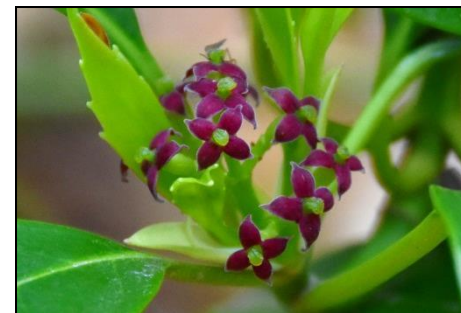
アオキの雌花と新葉 (アオキ科 (ガリア科)) 雌雄異株。