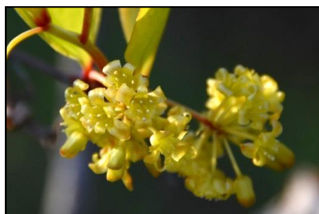
サルトリイバラの雄花 (サルトリイバラ科) 雌雄異株。小さいがよく見ると大変美しい。