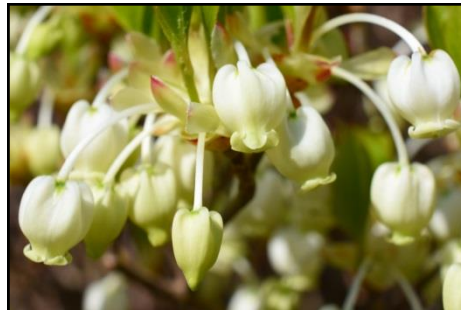
ドウダンツツジ (ツツジ科) 紅葉が美しいドウダンツツジが咲き始めた。