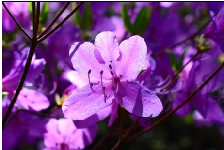
コバノミツバツツジ (ツツジ科) 今年は例年より早く、昨年より良く咲いている。