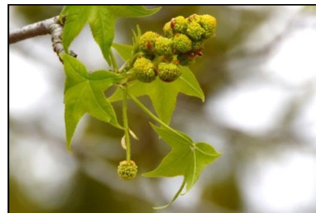
モミジバフウの雄花と雌花 (フウ科) 下向きに一個垂れ下がっているのが雌花。上方でまとまっているのが雄花。