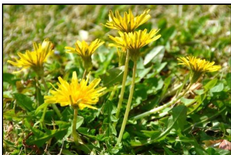
カンサイタンポポ (キク科) そうぼうがいへん 総苞外片が反り返らない。