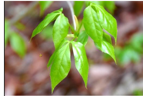
タカノツメの新葉 (ウコギ科) 黄葉が美しいが、新葉の展開も美しい。