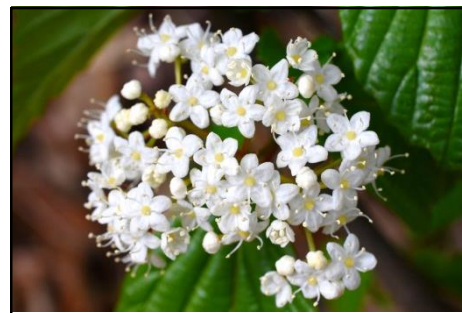
ガマズミ (レンブクソウ科)