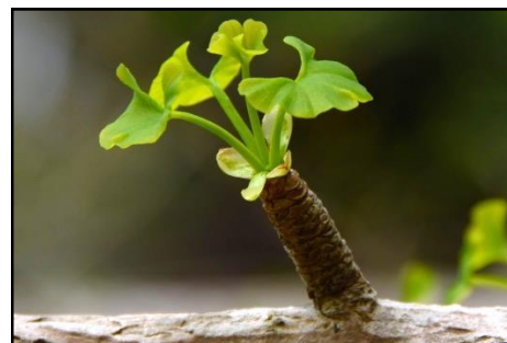
イチョウの新芽 (イチョウ科)