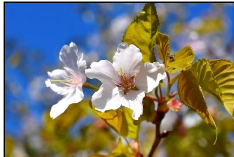
カスミザクラ (バラ科) ヤマザクラより遅めに開花し、花柄や葉柄に毛がある。