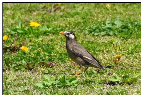
ムクドリ (ムクドリ科)