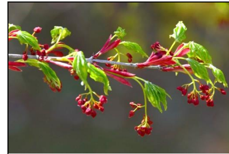
イロハモミジの新葉と花 (ムクロジ科) すぐに葉が展開し、翼果を形成する。