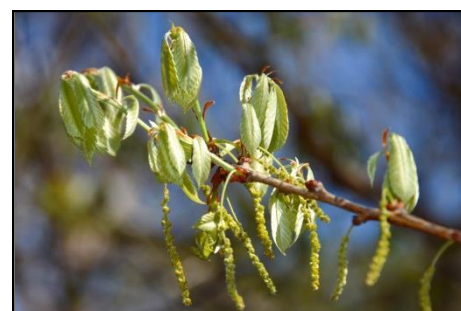
コナラの新葉と雄花 (ブナ科)