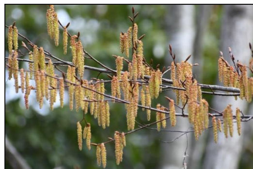
アカシデの花 (カバノキ科)