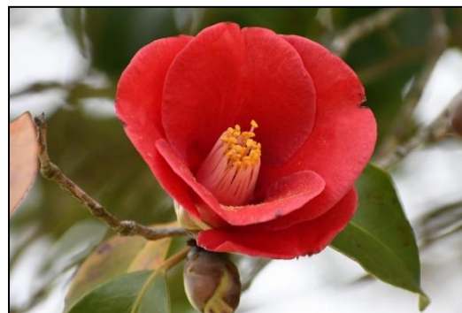
ヤブツバキ (ツバキ科) 花はポトッと落ちます。