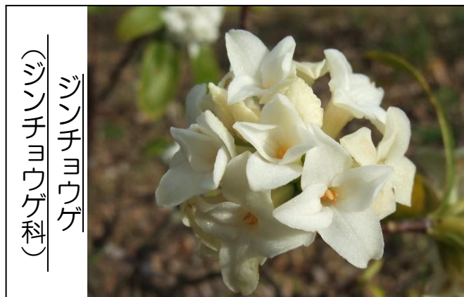
ジンチョウゲ (ジンチョウゲ科)