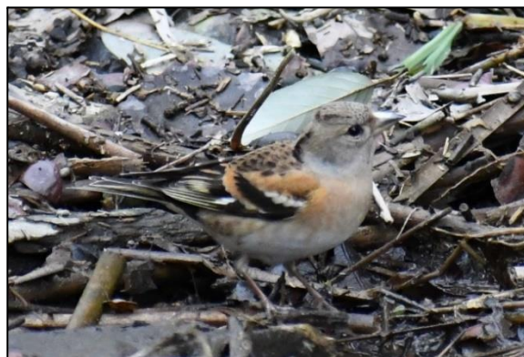
アトリの水飲み (アトリ)