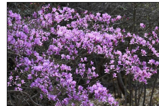
コバノミツバツツジ (ツツジ科)