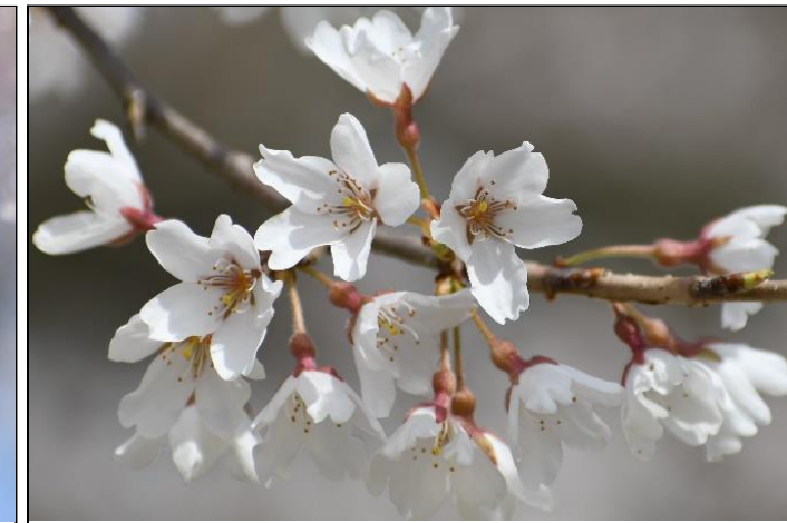
エドヒガン (バラ科) エントランス広場と森の三角橋の近くで咲いています。