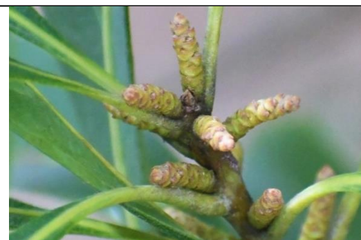
咲く前のヤマモモの雌花 (ヤマモモ科)