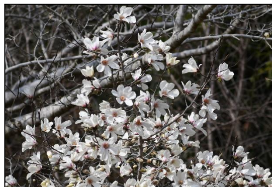
コブシ (モクレン科)