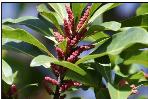
花粉を出す前のヤマモモの雄花 (ヤマモモ科)