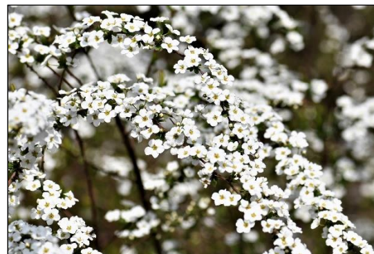
ユキヤナギ (バラ科)