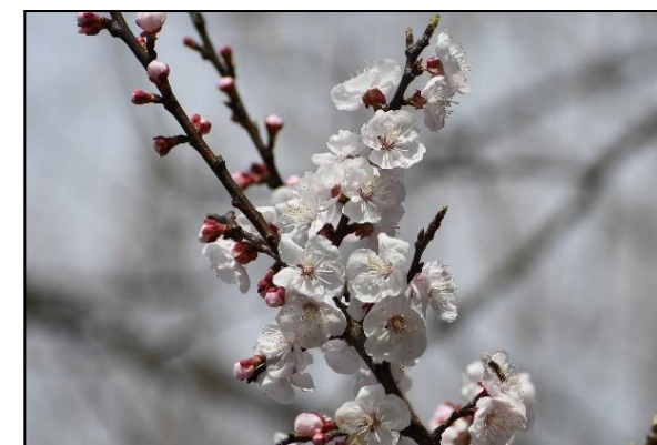
アンズ (バラ科) 満開です。