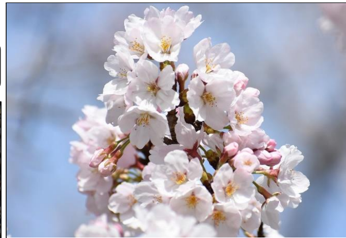
ソメイヨシノ (バラ科) ウッディ広場で咲いています。