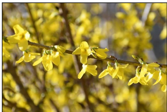
レンギョウ (モクセイ科)