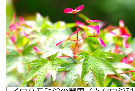
イロハモミジの翼果 (ムクロジ科) 4月に花が咲いたばかりだが、もう若い実ができています。