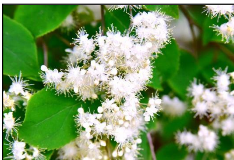
タンナサワフタギ (ハイノキ科) 白い花が良く目立つ。