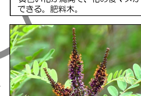
イタチハギ (マメ科) 法面緑化等に使用され、黄色い葯が目立つ。