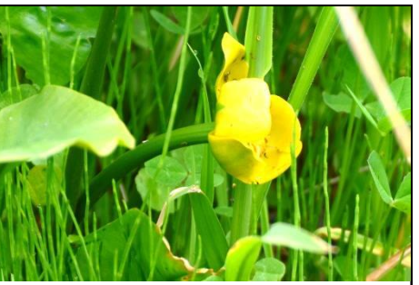
コウホネ (スイレン科) 黄色い花が咲いている。