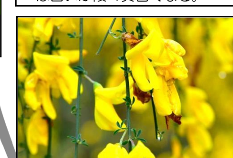
エニシダ (マメ科) 黄色い花が満開で、花の後マメができる。肥料木。