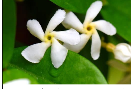
テイカカズラ (キョウチクトウ科) 常緑のつる性の木本で、白い花が目立つ。