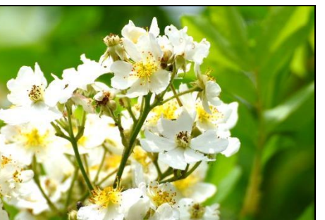
ノイバラ (バラ科) 香りが良い。