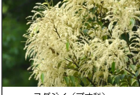
スダジイ (ブナ科) 花が咲いた翌年の秋にドングリ (堅果) が実る。