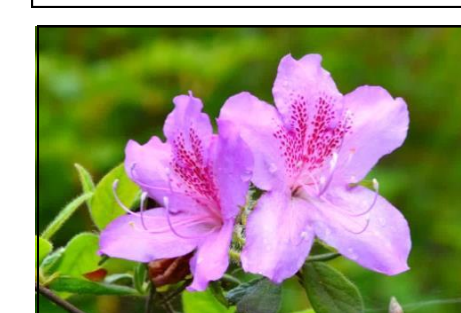
モチツツジ (ツツジ科) 萼や花柄をさわると、ねばねばしている。