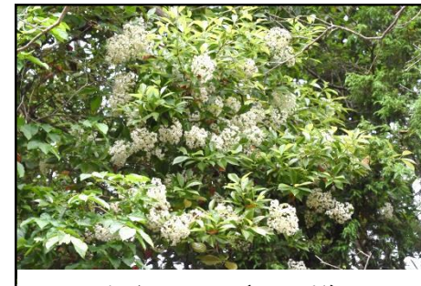
カナメモチ (バラ科) 白い五弁花が咲いており、実は初冬に赤く熟す。