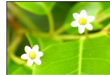
ソヨゴの雌花 (モチノキ科) 雌雄異株で、今白い花が咲いている。