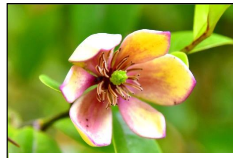
カラタネオガタマ (モクレン科) 花はバナナの様な甘い香りがする。