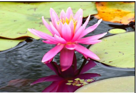
スイレン (スイレン科) 上池、下池で満開。