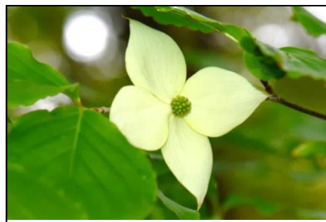
ヤマボウシ (ミズキ科) 秋に赤い実がなり、結構おいしい。