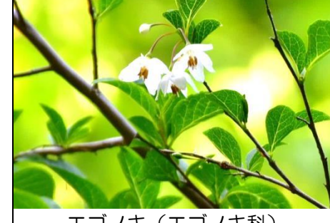
エゴノキ (エゴノキ科) 白い花が咲いている。昨年は良く咲いたが今年は花が少なめ。