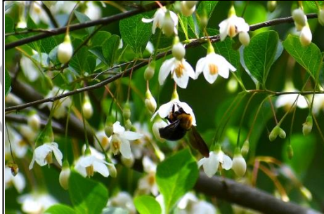
エゴノキ (エゴノキ科) 初夏に白い花が垂れ下がります。今年はよく咲いています。