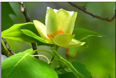
ユリの木の花 (モクレン科) ユリノキ、チューリップツリー、ハンテンボク (裨纏木)、リリオデンドロンなど、色々な名前が付けられています。