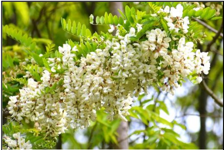
ニセアカシア (マメ科) 蜂蜜の蜜源植物として重要な植物です。