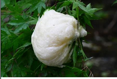
モリアオガエルの卵塊 (アオガエル科) 今年もモリアオガエルが産卵する季節になりました。