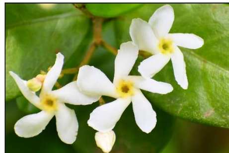
テイカカズラ (キョウチクトウ科) 常緑のツル性の木本で、花がプロペラの様に捻れています。