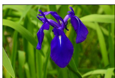
カキツバタ (アヤメ科) 花びらの中央が白くなっていることで、ハナショウブやアヤメと区別します。