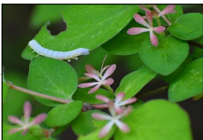
ツクバネウツギの萼片 (スイカズラ科) 花が終わり、特徴的な萼片が目立っています。