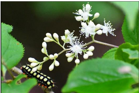
タンナサワフタギ (ハイノキ科) とシロシタホタルガ (マダラガ科) タンナサワフタギが満開で、その葉を食べる派手なシロシタホタルガの幼虫が居ます。