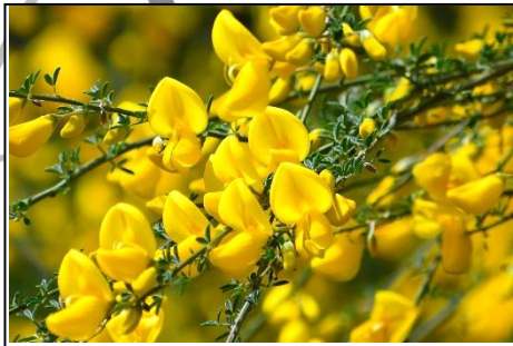
エニシダ (マメ科) 治山工事の肥料木として使われ、黄色い花がよく目立ちます。