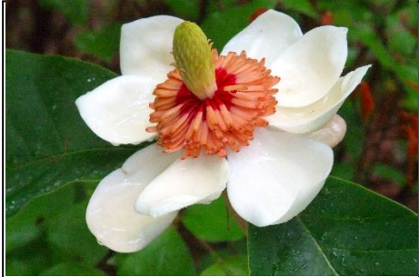
オオヤマレンゲ (モクレン科) 蕾が3個あります。