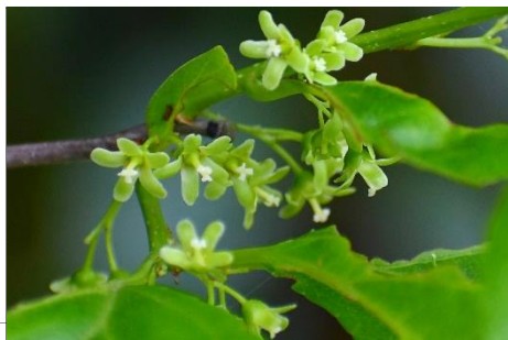
ツルウメモドキ (ニシキギ科) 雌雄異株。雌花が満開です。秋に熟す実は、メジロが大好きです。