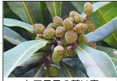
ヤマモモの若い実 (ヤマモモ科) 雌雄異株。雌木には今年は若い実が多く付いています。