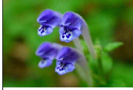
タツナミソウ（シソ科）