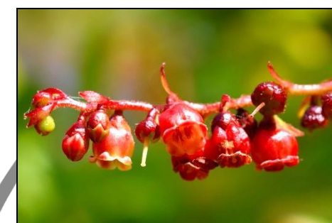
ナツハゼ（ツツジ科） 今花が咲き、秋には甘酸っぱい実が食べられる。