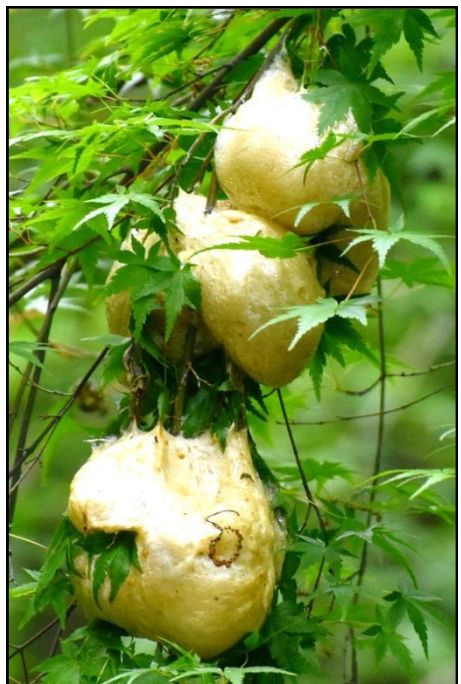
モリアオガエルの卵 （アオガエル科）