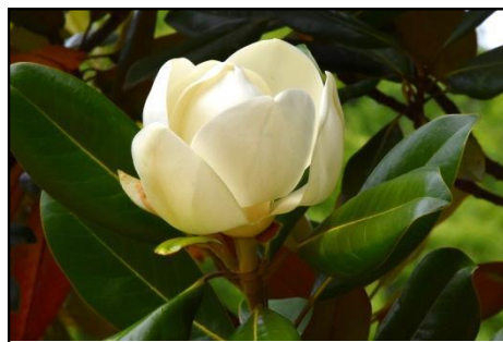
タイサンボク（モクレン科） 今年も咲き始めた。