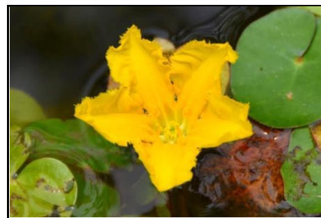
アサザ（ミツガシワ科）