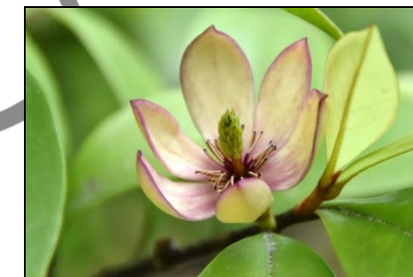
カラタネオガタマ（モクレン科） バナナの様な良い香りがする。