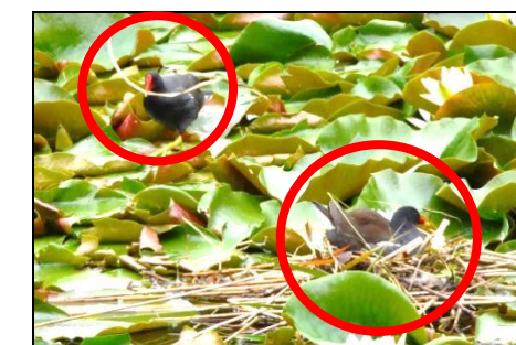
バンの巣（下池のスイレンの葉の上） （クイナ科）1羽は抱卵し、1羽は けなげに巣の材料を集めている。