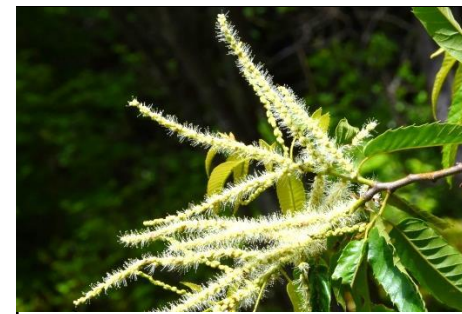
クリ（ブナ科） クリの花が満開。