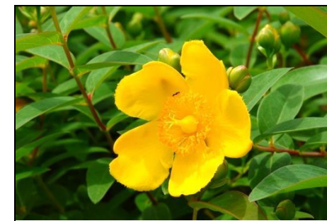
ヒペリカム（ヒドコト） （オトギリソウ科） カリシナムはまだ堅いつぼみ。