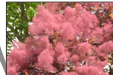
スモークツリー（ウルシ科）