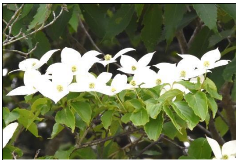
ヤマボウシ（ミズキ科） 花期が長く、長期間花を楽しめる。