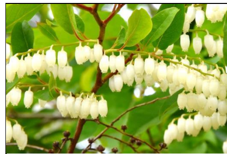
ネジキ（ツツジ科） 可憐で見てたえのある白い花。