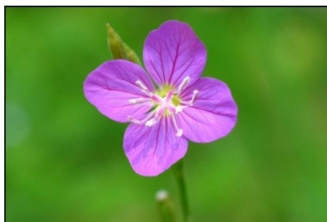
ユウゲショウ（アカバナ科） アフリカ原産の帰化植物。