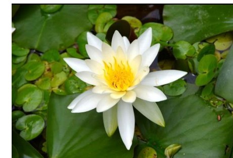
スイレン（スイレン科）