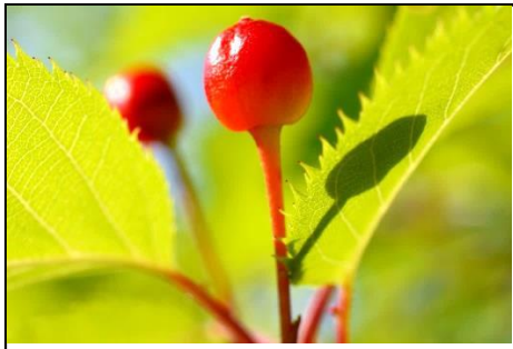
サクランボ（バラ科） カスミザクラのサクランボが大分大きくなった。