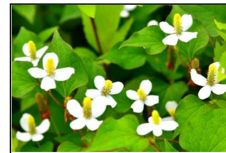
ドクダミ（ドクダミ科） 地上部を乾燥させたものは十薬と呼ばれる。