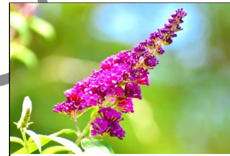
ブッドレア（フジウツギ科）