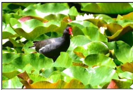
バンの成鳥と幼鳥（クイナ科） 生まれたての幼鳥は親の様にくちばしの上が赤いが、ある程度大きくなると赤色が消える。