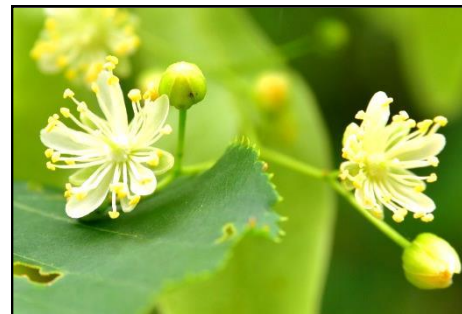
ボダイジュ（シナノキ科）