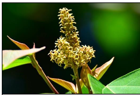
雌花 アカメガスワ（トウダイグサ科） 雄花