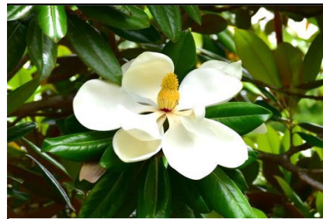
タイサンボク（モクレン科）