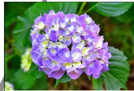
アジサイ（アジサイ科）