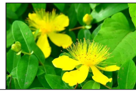
ヒペリカム ヒドコートとカリシナム （オトギリソウ科）