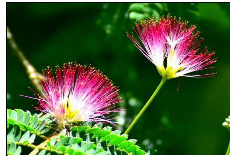
ネムノキ（マメ科） ネムノキの名前は夜になると葉が閉じる（就眠運動）ことからついた。