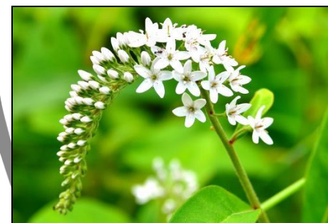
オカトラノオ（サクラソウ科）