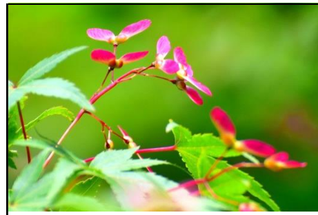
イロハモミジの若い実（ムクロジ科）