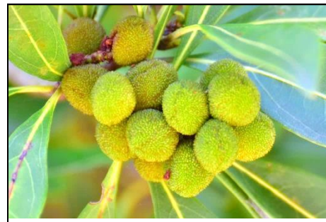
ヤマモモの若い実（ヤマモモ科） 雌雄異株のため、雌株のみに実がつく。