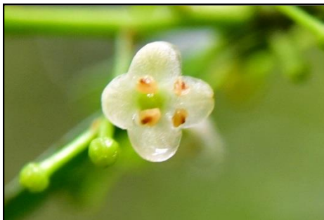
イヌツゲの雄花（モチノキ科）