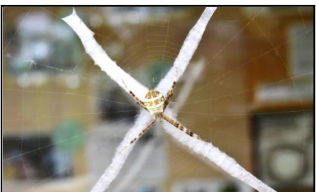
コガタコガネグモ (コガネグモ科) 葉には×印の「隠れ帯」という帯状のものを作ります。