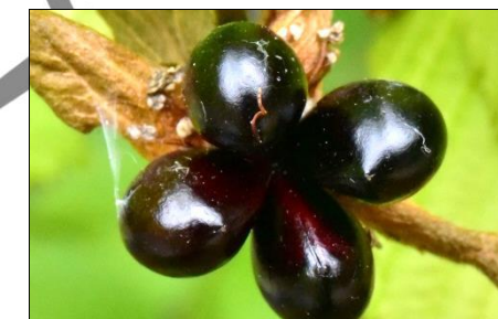
シロヤマブキの実 (バラ科) 果実は黒色で、1つの花に4個ずつつきます。