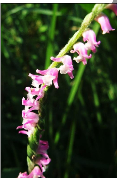
ネジバナ (ラン科) 1つ1つの花が小さいですが、「蘭」の花が並んでいます。