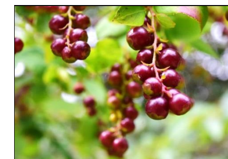
ナツハゼの実 (ツツジ科) 今は実が赤い。その後黒く熟し、甘酸っぱい味がします。