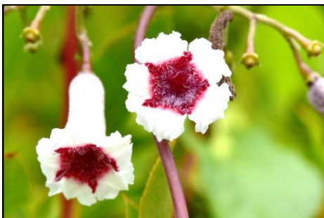
ヘクソカズラ (アカネ科) 葉や茎から強い臭いがすることからこの名前が付けました。