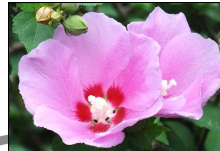
ムクゲ (アオイ科) ハイビスカスの仲間です。