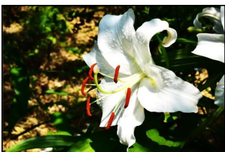
カサブランカ (ユリ科) 大変立派な大輪のユリです。