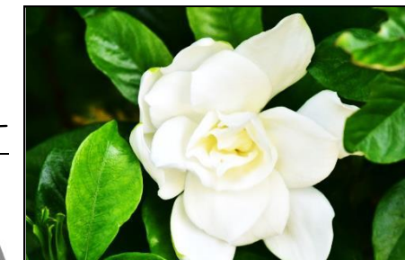
クチナシ (アカネ科) 良い香りを楽しんでください。