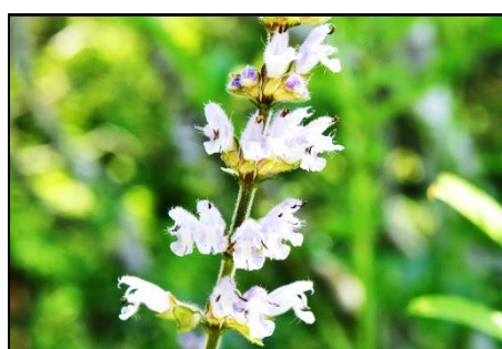
アキノタムラソウ (シソ科)