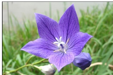
キキョウ (キキョウ科) 秋の七草だが、夏の花のイメージがある。