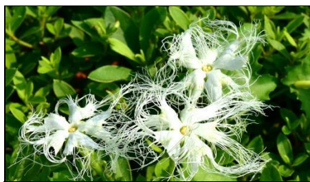
カラスウリ (ウリ科) 日没後に開花します。雌雄異株。写真の花は雄花なので、赤い実はありません。