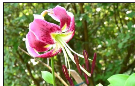
カノコユリ (ユリ科) 名前は花弁の鹿の子模様から付けました。