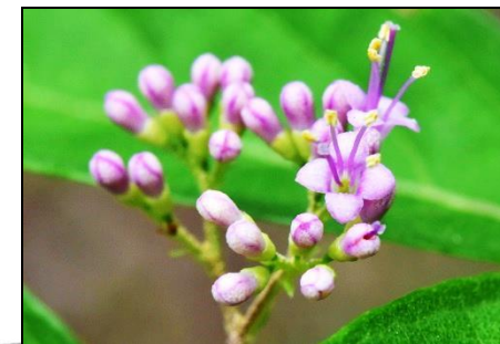
ムラサキシキブ (シソ科) 秋に紫色の実ができます。