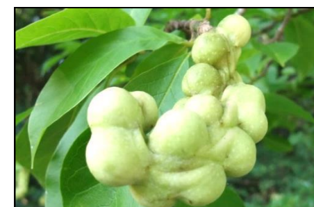
コブシの若い実 (モクレン科) 実の形が握りこぶしに似ているので、「コブシ」という名が付けられています。