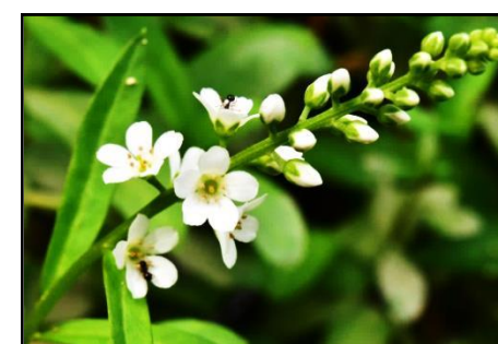
ヌマトラノオ (サクラソウ科)