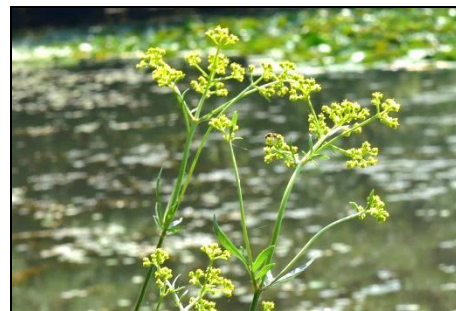
オミナエシ (オミナエシ科) 秋の七草の一つであるオミナエシが咲き始めました。