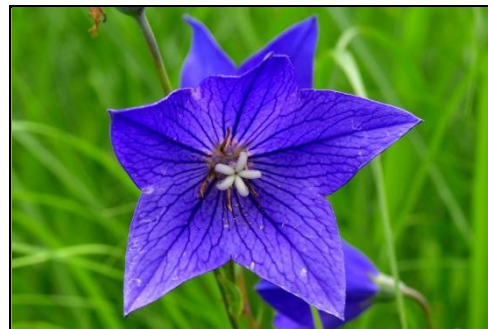
キキョウ (キキョウ科) 秋の七草。蕾も美しい。