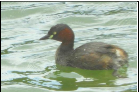
カイツブリ (カイツブリ科) 奥池(水源池)で獲物を捕獲中。