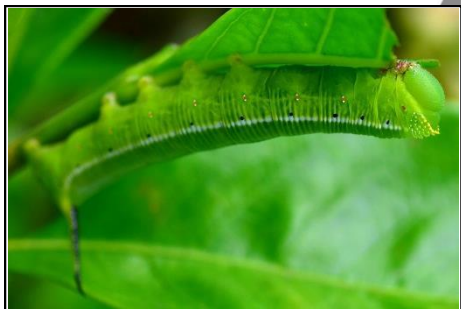
オオスカシバの幼虫 (スズメガ科) ツノが特徴。