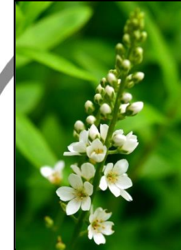
ヌマトラノオ (サクラソウ科)