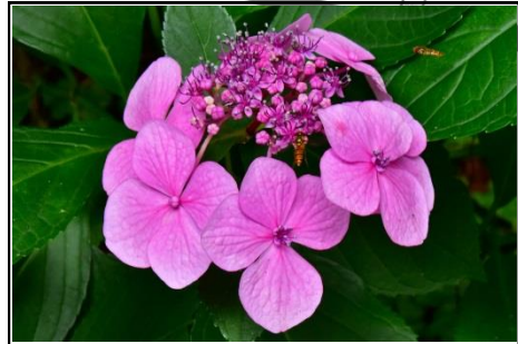
ガクアジサイ (アジサイ科)