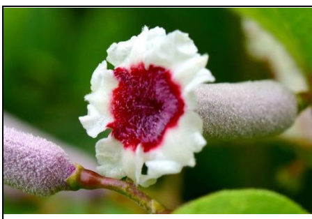
ヘクソカズラ (アカネ科) 名前は葉や茎に悪臭がある ことから。別名ヤイトバナ。