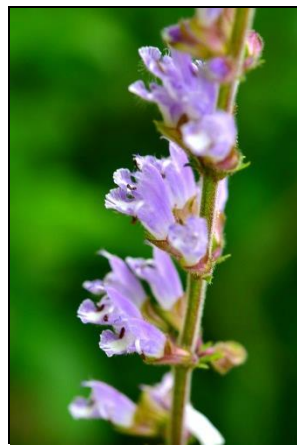
アキノタムラソウ (シソ科)