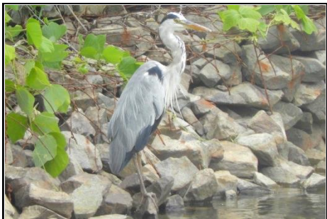
アオサギ (サギ科) 奥池(水源池)で獲物を探索中。