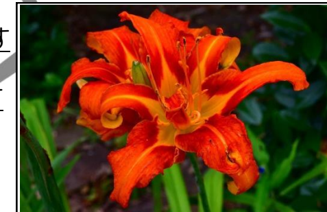
ヤブカンゾウ (ユリ科)