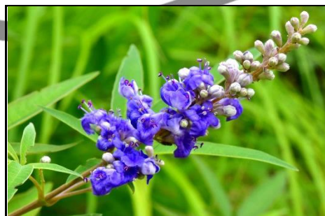
セイヨウニンジンボク (シソ科) ハーブとして使用される。