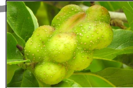
コブシ (モクレン科) 若い実ができ始めている。