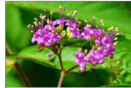
コムラサキ (シソ科)