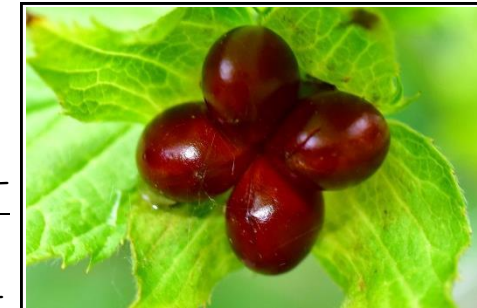
シロヤマブキの実 (バラ科) 花弁が5枚あるシロヤマ ブキの実