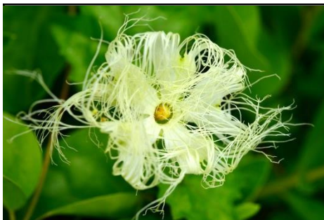
カラスウリ雄花 (ウリ科) 夜間に開花します。雌雄 異株。写真の花は雄花。