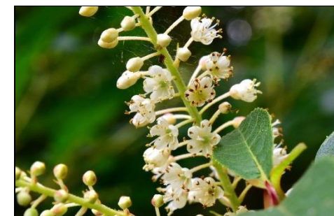
リョウブ (リョウブ科) 三木山に多く、今の時期に 白い花が咲く。