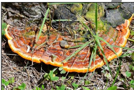
ベッコウタケ (サルノコシカケ科) 駆除するのが難しい菌。樹木を 腐らせ、倒木を誘発する。