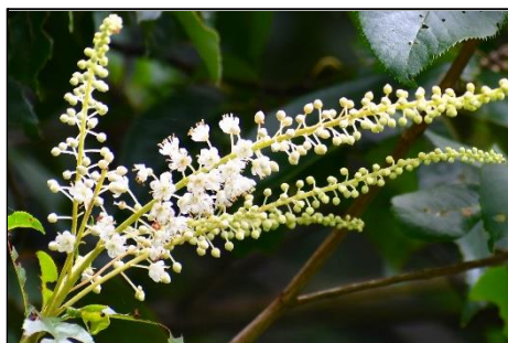
リョウブ (リョウブ科) 三木山に多く、今の時期に 白い花が目立つ。