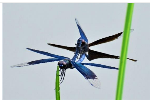
チョウの様に飛ぶことから名づけられた。