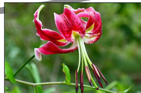
カノコユリ (ユリ科) 花卉の鹿の子模様からこの名前が付いた。