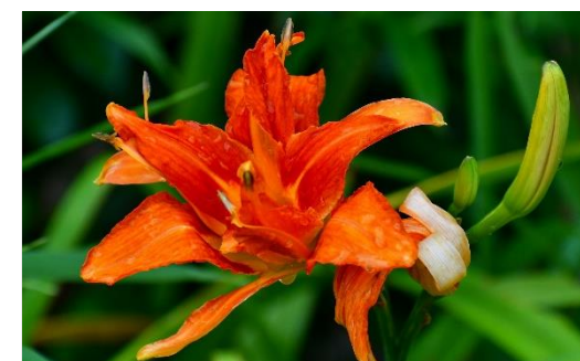
ヤブカンゾウ (ユリ科)