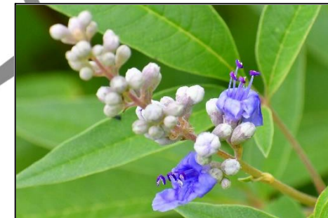
セイヨウニンジンボク (シソ科) 花や葉に芳香がある。