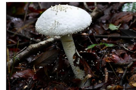
シロオニタケ (テングタケ科) 大きなきのこで、林内でよく目立つ。