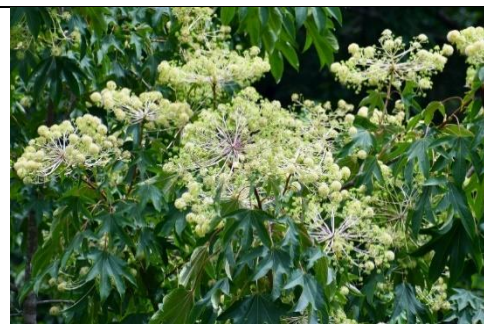
ハリギリ (ウコギ科) 枝や幹に鋭い棘があり、 今の時期白い花が目立つ。