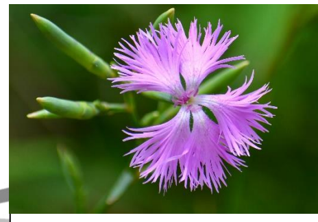
カワラナデシコ (ナデシコ科) 秋の七草の一つ。