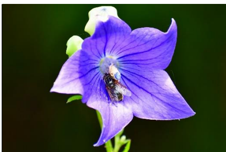
キキョウ (キキョウ科) 秋の七草の一つだが、 夏の花のイメージ。