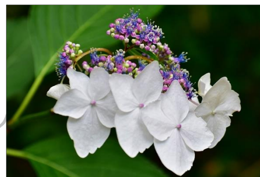
アジサイ (アジサイ科) アジサイが連絡道で見られます。