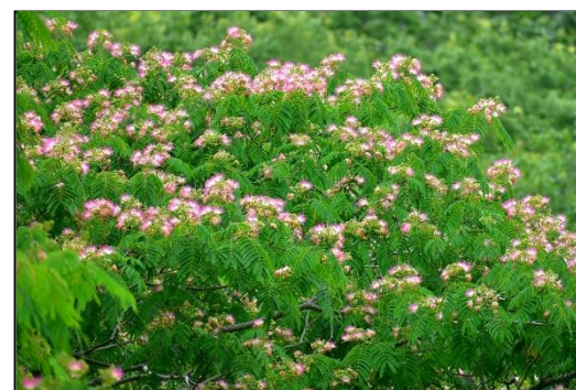
ネムノキ (マメ科) ネムノキが満開です。