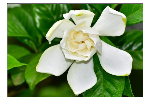
クチナシ (アカネ科) 強い芳香のある白い花を咲かせます。