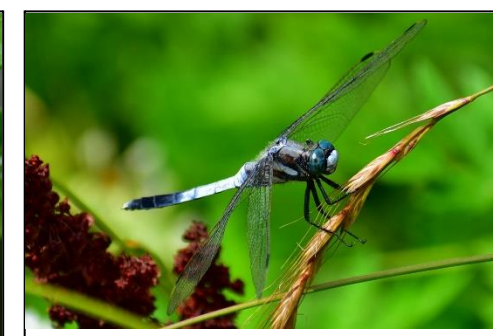
シオカラトンボ (トンボ科) 上池、下池周辺で飛んでいます。