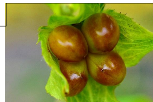
4個の実ができています。秋には黒く熟します。