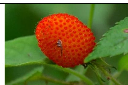
コジキイチゴの実 (バラ科)

令和3年6月上旬のみどころで紹介した紅紫色の腺毛と鉤状の棘が特徴のコジキイチゴの実です。食べられます。