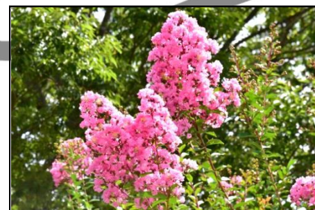
サルスベリ (ミソハギ科) 夏の花サルスベリが満開です。