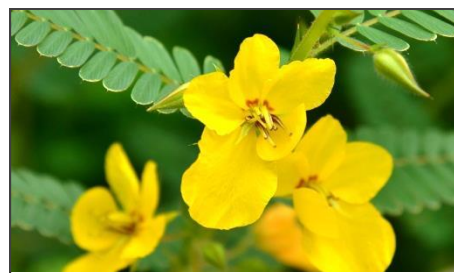
アレチケツメイ (マメ科) 国内産のカワラケツメイと共に、 ツマグロキチョウの食草として 知られている帰化植物です。