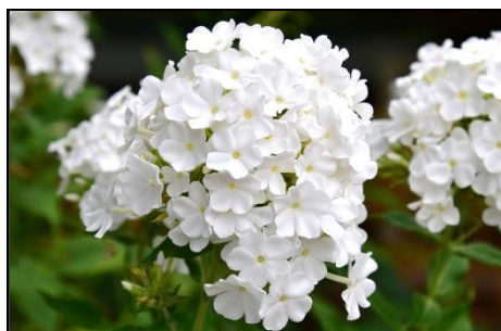
宿根フロックス (ハナシノブ科) 真夏に咲いてくれる宿根草です。