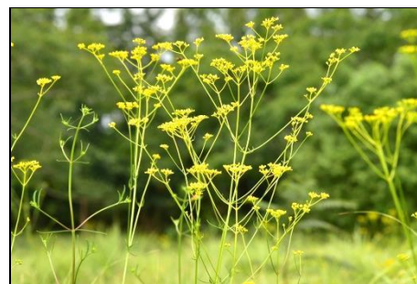
オミナエシ (オミナエシ科) 秋の七草の一つです。