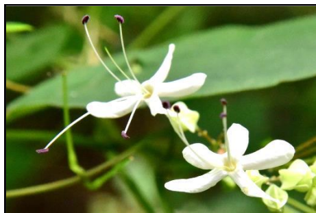
クサギ (シソ科) 個性的なおいがしますが、 花も実も大変美しい樹木です。