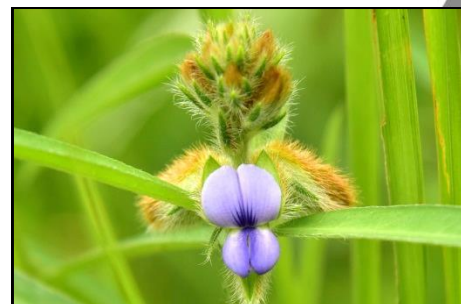
タヌキマメ (マメ科)