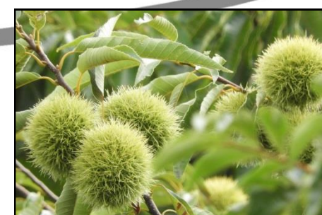
クリの若い実 (ブナ科) クリの実が大分大きくなりました。