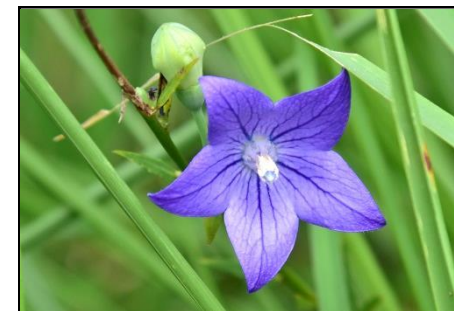
キキョウ (キキョウ科) 秋の七草の一つです。