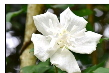
ムクゲ (白花で八重) (アオイ科) ハイビスカス属の植物です。 長い期間花が咲きます。