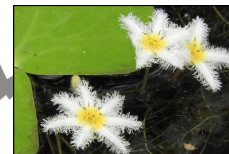
ガガブタ (ミツガシワ科) 下池で開花中です。昨年よりも開花数が 多くなっています。基本は5弁花ですが、 6弁、7弁のものもあります。