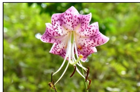
カノコユリ (ユリ科) 鹿の子絞りに似た模様がある ことからこの名前が付けました。