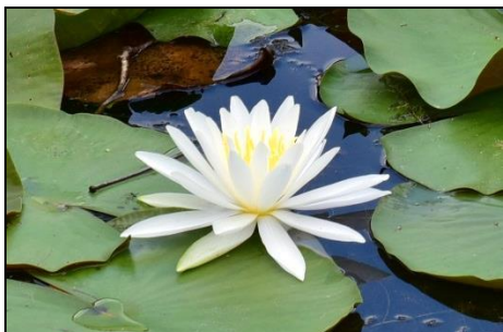
スイレン (スイレン科) 上池、下池で満開です。