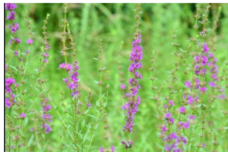
ミソハギ (ミソハギ科) 水辺の植物で、別名「盆花」 ともいわれています。