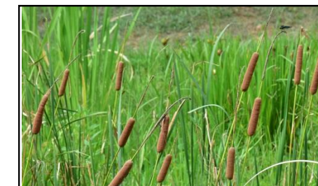
ヒメガマ (ガマ科) ウインナソーセージの様な部分が「雌花群」 その上が「雄花群」と呼ばれています。