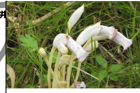
ナンバンギセル (ハマウツボ科) イネ科に寄生する一年草で、 三木山森林公園では、ススキに 寄生しています。