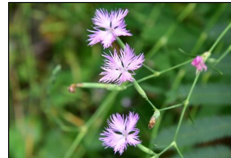
カワラナデシコ (ナデシコ科) 秋の七草の一つです。