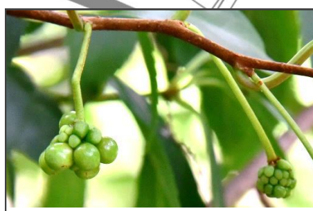
サネカズラの若い実 (マツバサ科) 秋に赤い実がなりますが、 若い実が大きくなりつつあります。