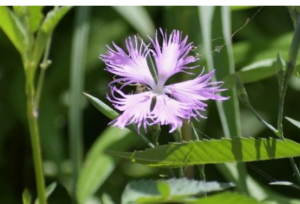
カワラナデシコ (ナデシコ科) ③