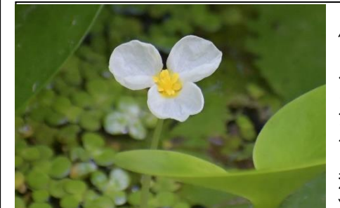
トチカガミ (トチカガミ科) ⑥