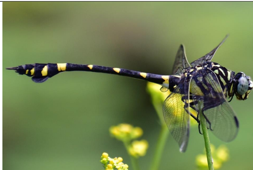
台湾ウチワヤンマ (サナエトンボ科)

【参考文献：おおさか環農水研のサイト】 https://www.knsk-osaka.jp/zukan/zukan_database/konchu/5350b31ec1be415/7050c048a2ac103.html