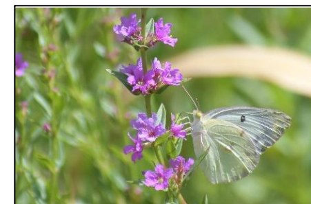
ミソハギ (ミソハギ科) ⑧ お盆の頃に紅紫色の花を先端部に多数つけ、盆花として使われます。