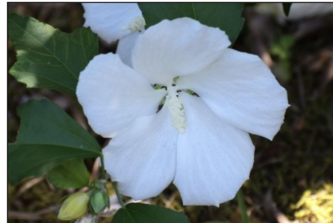
ムクゲ (アオイ科) ⑤ 高さが3~4mになる Hibiscus 属の落葉低木です。