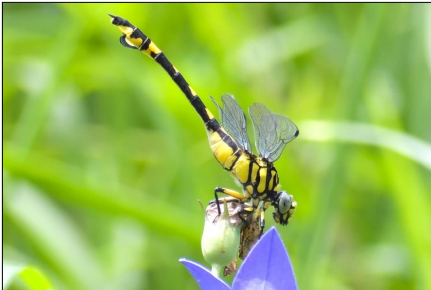
ウチワヤンマ (サナエトンボ科)

下池に、腹部に「ウチワ」の様な半円形の付属物があるトンボが2種類います。「ウチワ」が黄色いウチワヤンマと「ウチワ」が黄色くない台湾ウチワヤンマです。