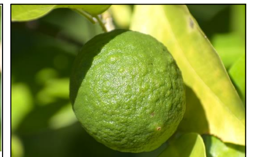
ダイダイ (ミカン科) ⑨ 若い実ができています。鏡餅や正月飾りとして使われます。鑑賞用ですので、実を取らないでくださいね。