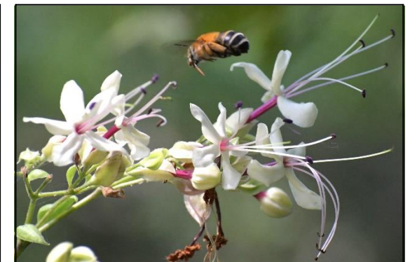
クサギ (シソ科) ④ 枝や葉は独特のにおいがしますが、芳香のある花が多数咲きます。