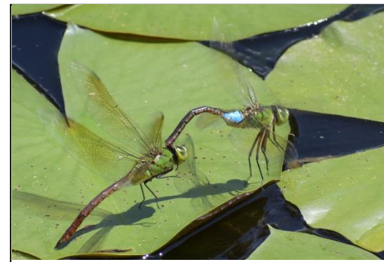
ギンヤンマ (ヤンマ科)