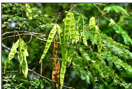
ネムノキの若い実(豆) (マメ科) 大きなマメができています。