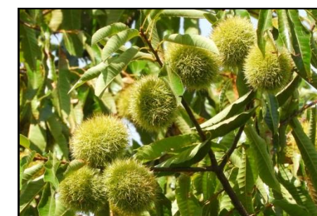
クリの若い実 (ブナ科) もうすぐ熟します。