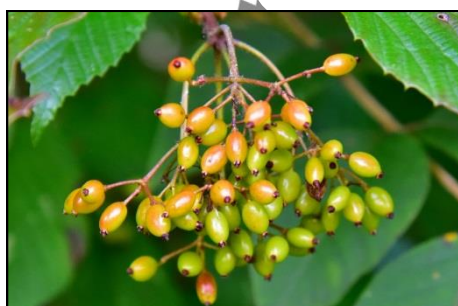
ガマズミの若い実 (レンブクソウ科) 熟すと赤くなります。