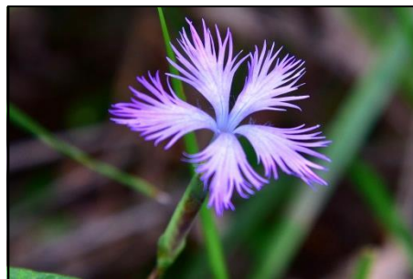
カワラナデシコ (ナデシコ科) 秋の七草の一つです。