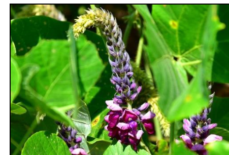
クズ (マメ科) 他の植物に巻き付く荒々しい イメージのクズですが花は美しい。