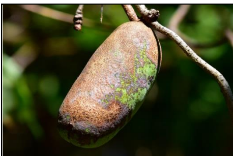
ミツバアケビの熟しかけた実 (アケビ科) もうすぐ甘い実が熟します。