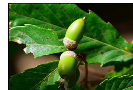
コナラの若い実 (ブナ科) ドングリが大大大きくなって きました。