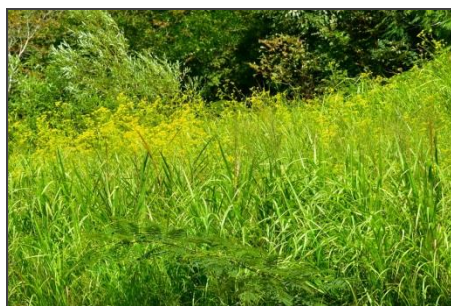
オミナエシ (オミナエシ科) 秋の七草の一つです。