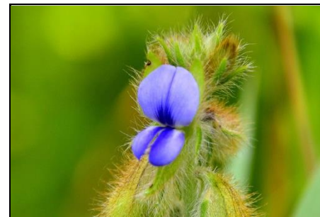
タヌキマメ (マメ科) かわいいイメージの マメ科の植物です。