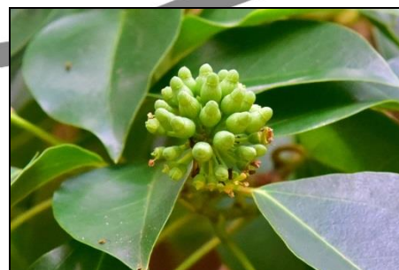
カクレミノの若い実 (ウコギ科)