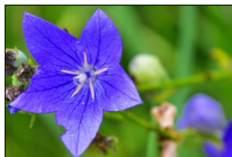
キキョウ (キキョウ科) 秋の七草の一つです。