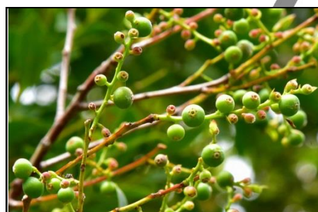
シャシャンボの若い実 (ツツジ科)