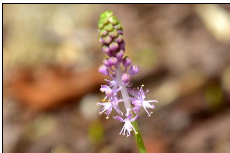
ツルボ (キジカクシ科) 今年もツルボの花芽がよきよき伸びてきました。