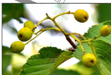
アズキナシの若い実 (バラ科) 熟すと赤くなります。