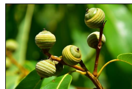
シラカシの若い実 (ブナ科)