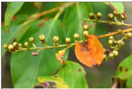
ネジキの実 (ツツジ科)