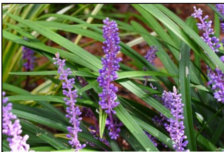
ヤブラン (キジカクシ科)