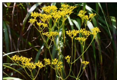
オミナエシ (オミナエシ科) 秋の七草の一つです。