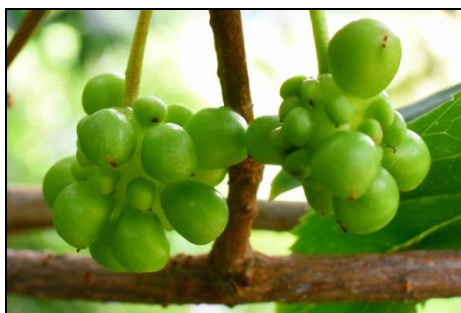
サネカズラの若い実 (マツバサ科) 熟すと真っ赤になります。