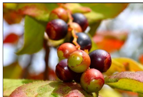
ナツハゼの実 (ツツジ科) 酸っぱくておいしい実です。