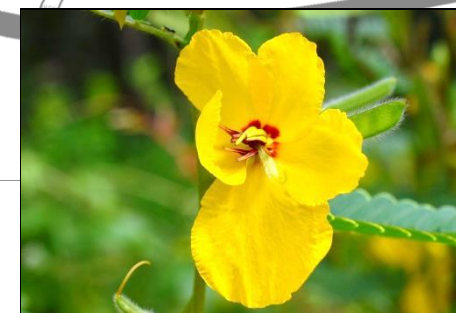
アレチケツメイ (マメ科) 国内産のカワラケツメイと共に、 ツマグロキチョウの食草として 知られている帰化植物です。