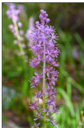
ツルボ (キジカクシ科)