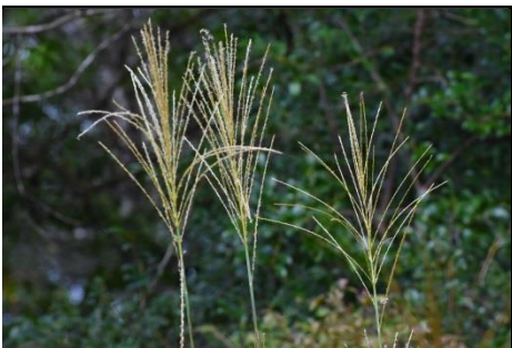
ススキの穂 (イネ科) ススキの穂が出始めました。