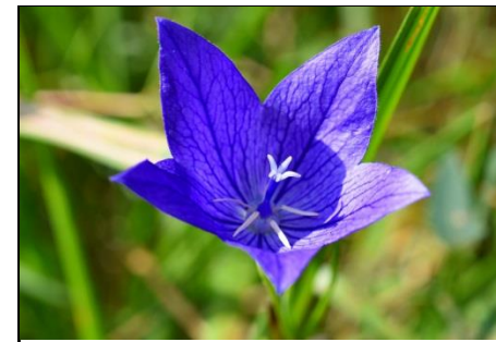
キキョウ (キキョウ科) 秋の七草の一つです。