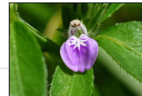
キツネノマゴ (キツネノマゴ科) 直径2mm位の小さいけれども かわいい花です。同じ科の園芸植 物 Acanthus mollis は大きく、 1mを越す草丈になります。