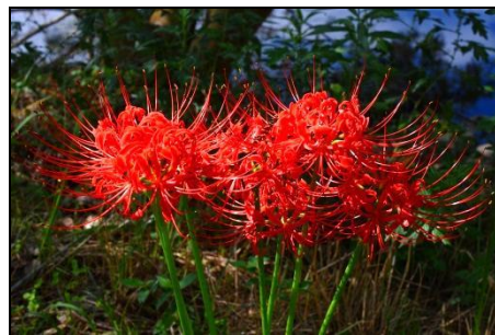
ヒガンバナ (ヒガンバナ科) 律儀に彼岸に咲きます。但し、 今年は三木山では若干早めです。