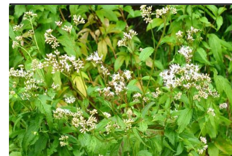
フジバカマ (キク科) 秋の七草の一つです。