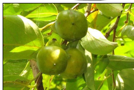
カキノキの若い実 (カキノキ科)