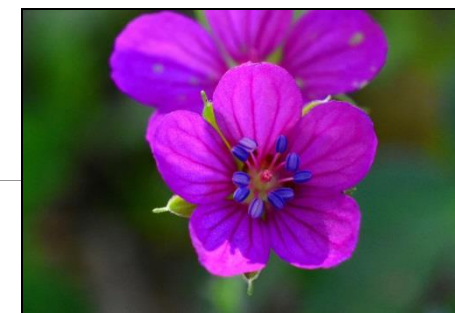
ゲンノショウコ (フウロソウ科) 整腸生薬として知られています。