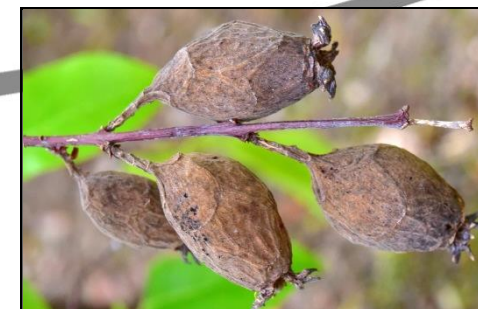
ソシンロウバイの実 (ロウバイ科) 正確には偽果といいます。中に瘦果(そうか)が入っています。