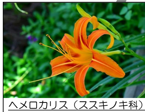
ヘメロカリス (ススキノキ科)