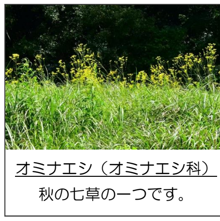
オミナエシ (オミナエシ科) 秋の七草の一つです。