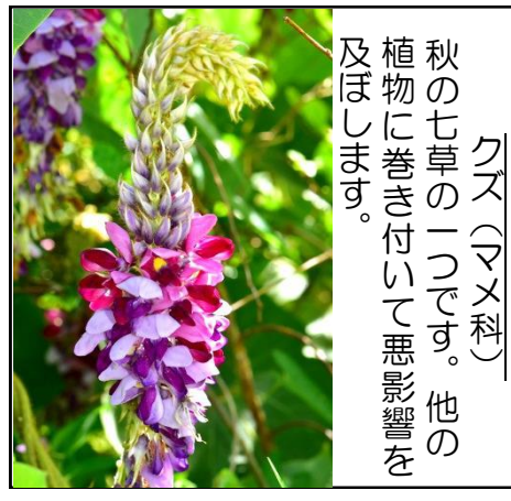
クズ (マメ科) 秋の七草の一つです。他の植物に巻き付いて悪影響を及ぼします。