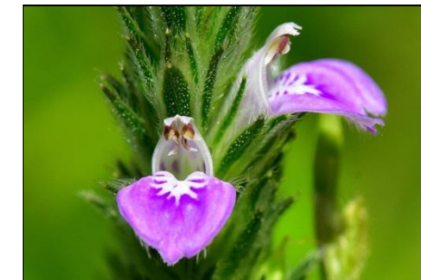
キツネノマゴ (キツネノマゴ科) 小さいが、かわいい花です。同じ科の園芸植物 Acanthus mollis は巨大な花です。