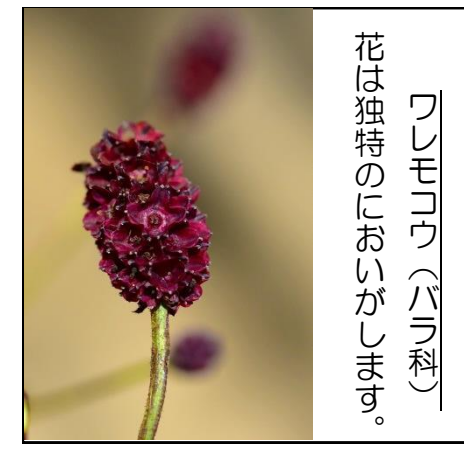
ソシンロウバイ (バラ科) 花は独特のにおいがします。