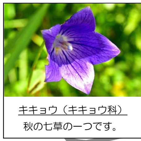
キキョウ (キキョウ科) 秋の七草の一つです。