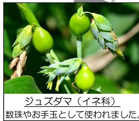
ジュズダマ (イネ科) 数珠やお手玉として使われました。