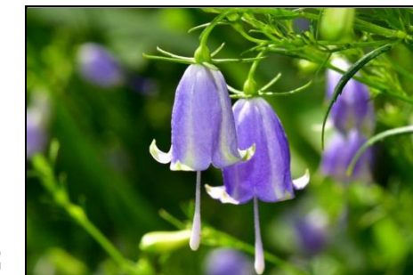
ツリガネニンジン (キキョウ科) 鐘形の花が特徴です。