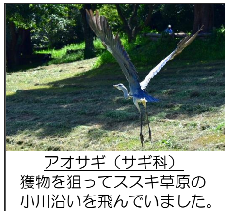
アオサギ (サギ科) 獲物を狙ってススキ草原の小川沿いを飛んでいました。