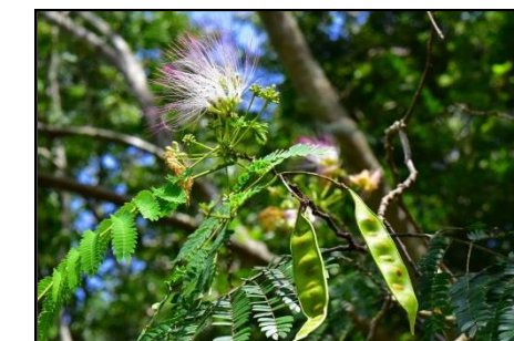
ネムノキの花と実(豆) (マメ科) 花の時期は過ぎましたが、現在、花と実(豆)が同時に見られます。