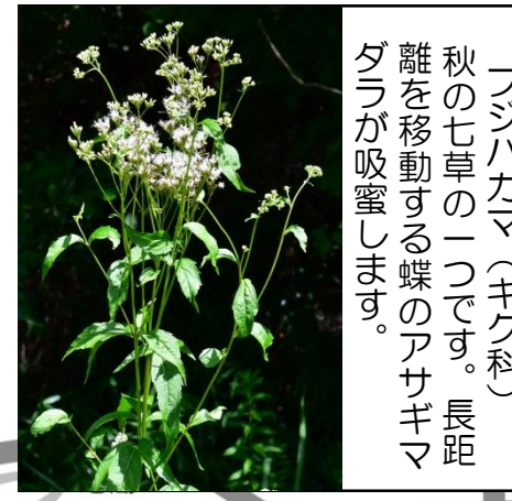
フジバカマ (キク科) 秋の七草の一つです。長距離を移動する蝶のアサギマダラが吸蜜します。