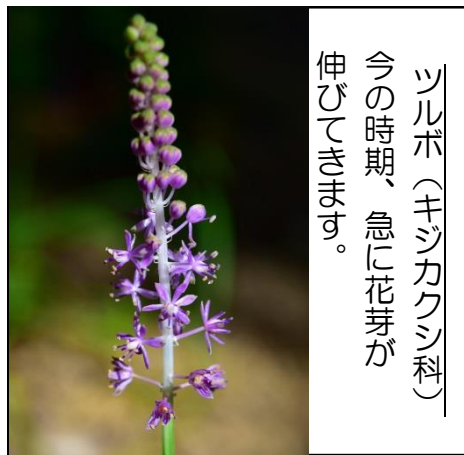
ツルボ (キジカクシ科) 今の時期、急に花芽が伸びてきます。