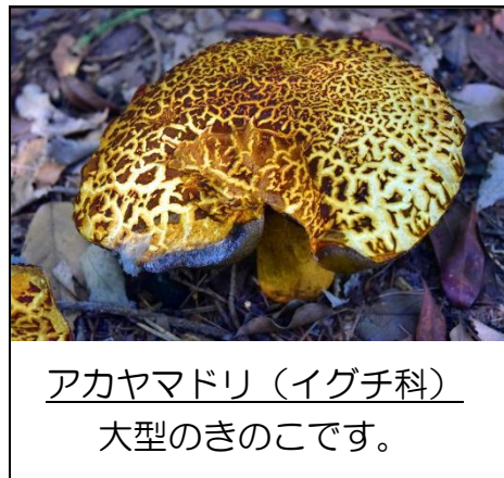
アカヤマドリ (イグチ科) 大型のきのこです。