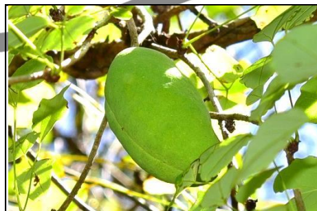
ミツバアケビ (アケビ科) 秋になると熟して甘くなります。