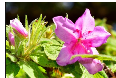
モチツツジの狂い咲き (ツツジ科) 花期以外にもよく数輪咲いていることがあります。