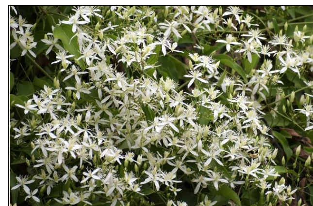
センニンソウ (キンポウゲ科) ⑤ つる性の多年草の有毒植物で白い花が満開です。但し、白い花弁に見えるのは花弁ではなく、萼片です。