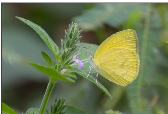
ツマグロキチョウ (シロチョウ科) ツマグロキチョウは、カラケツメイのみを食草としています。カラケツメイはマメ科の1年草で、お茶の代用として昔から飲まれています。