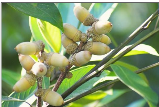
マテバシイの若いどんぐり (ブナ科) ③ 順調に育っています。