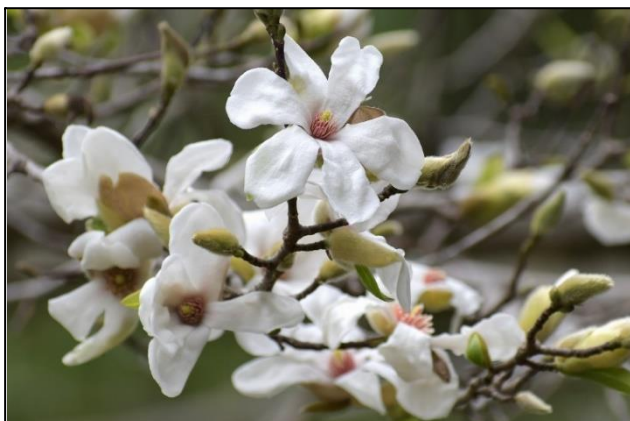
コブシの狂い咲き (モクレン科) ⑥

今年の猛暑や少雨のせいでコブシが葉を散らしてしまいました。このため、葉から供給される開花を抑制するホルモンの供給が断たれたことから、季節はずれの開花が見られました。