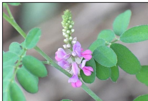
コマツナギ (マメ科) ⑧ 和名は馬を繋げるくらい幹が丈夫なことからこう名付けられています。