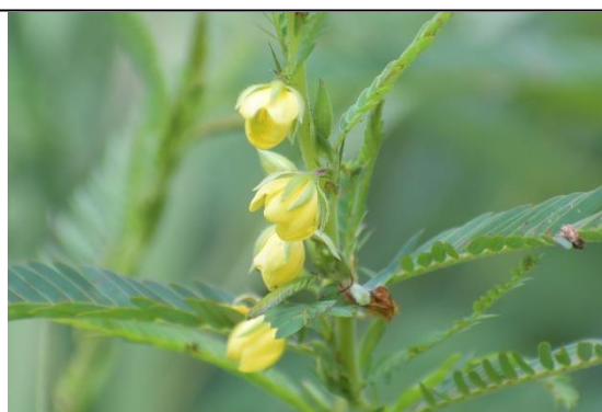
カラケツメイ (マメ科) ④