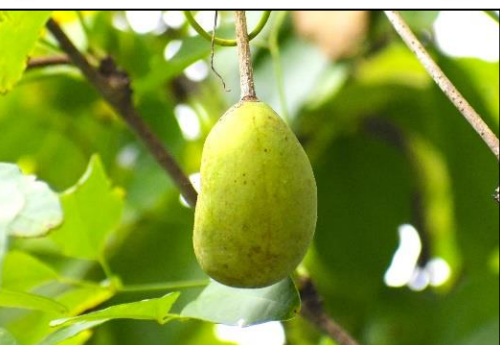
ミツバアケビの若い実 (アケビ科) ② 若い実が順調に育っています。