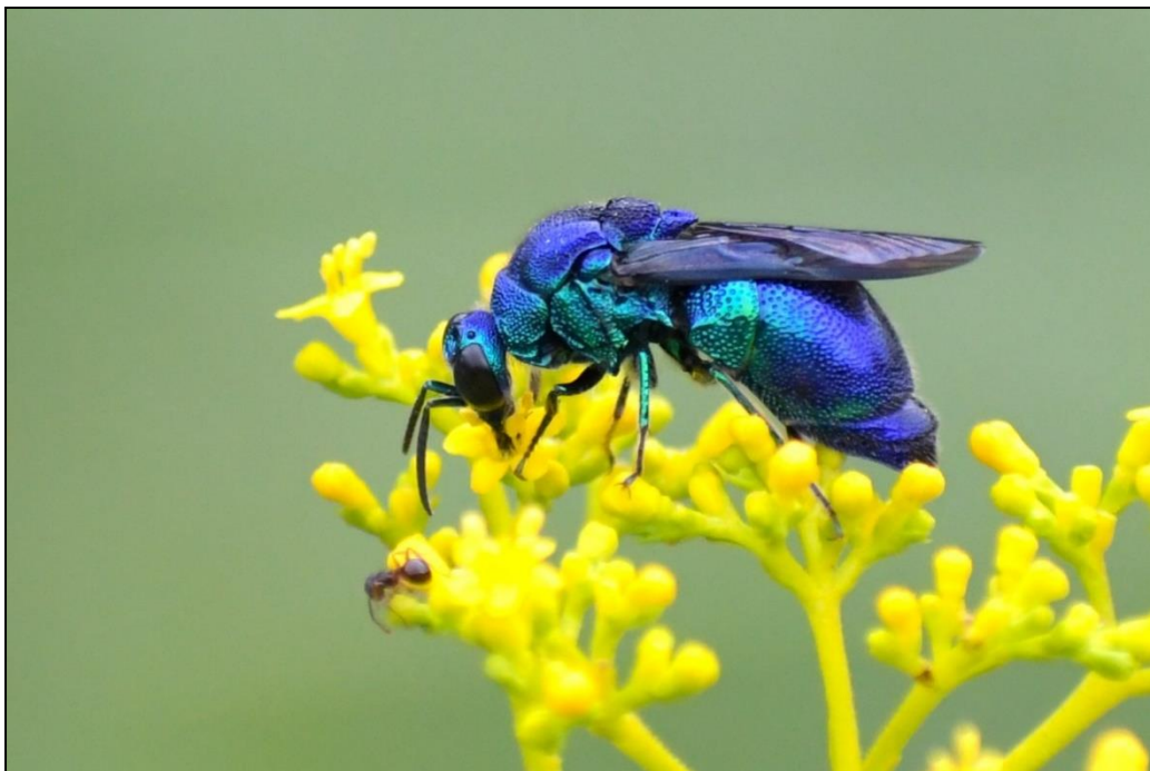
この青色や緑色に輝く「大青蜂」というハチは、オミナエシなどの花によく来ています。