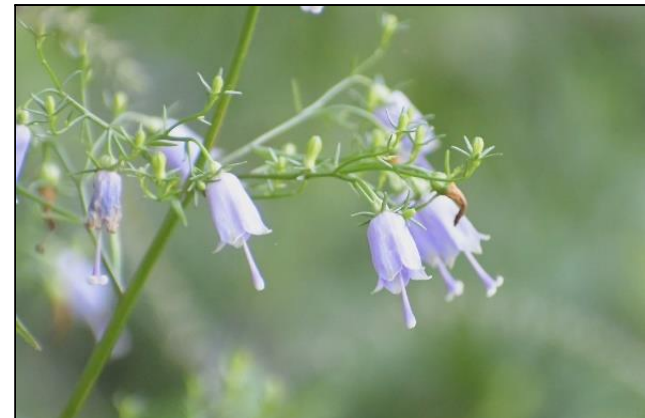
ツリガネニンジン (キキョウ科) ① 花の形が釣鐘に似ていること、根の形がチョウセンニンジンに似ていることからツリガネニンジンと呼ばれています。