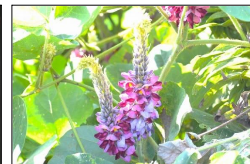
クズ (マメ科) ⑩ 美しい花を咲かせるツル植物です。他の植物に巻き付いて害を与えます。秋の七草の一つです。