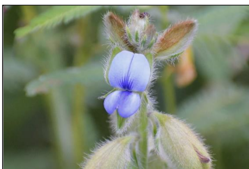
タヌキマメ (マメ科) ⑦ 花や実の様子がタヌキに似ていて、かわいいイメージの植物です。

今年の猛暑や少雨のせいでコブシが葉を散らしてしまいました。このため、葉から供給される開花を抑制するホルモンの供給が断たれたことから、季節はずれの開花が見られました。