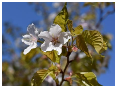
カスミザクラ(バラ科)★

秋に甘い実をつけるツル性植物。上方で大きく開いているのが実になる雌花、その下に集まっているのが雄花です。