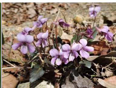
シハイスミレ(スミレ科)

林内のやや湿った場所に群生します。有毒植物ですがウスバシロチョウ(当園にはいません)の幼虫の食草になります。