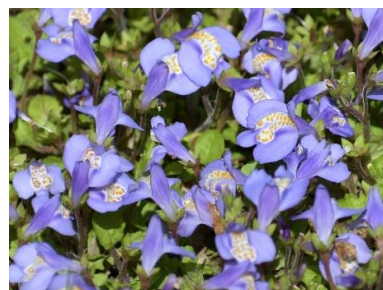
サギゴケ(サギゴケ科)★

可憐な花なのに別名はジゴクノカマノフタ。地面にへばりつくように放射状に広がる葉を「地獄の釜のふた」に見立てたものです。