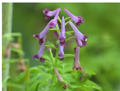
ムラサキケマン(ケシ科)★

林内のやや湿った場所に群生します。有毒植物ですがウスバシロチョウ(当園にはいません)の幼虫の食草になります。