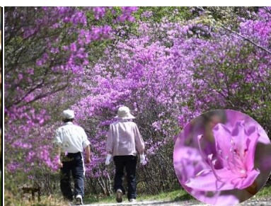
コバノミツバツツジ(ツツジ科)★

小さいことを表す「姫」をつけた姫サカキが名前の由来と言われます。花は都市ガスに似た独特の強い匂いを放ちます。