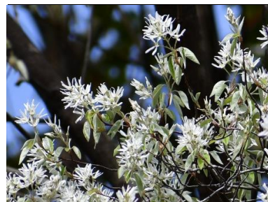
ザイフリボク(バラ科)★

この地域に自生するサクラの一つ。葉の展開と同時に開花し、花柄や葉柄に毛があるのが特徴です。