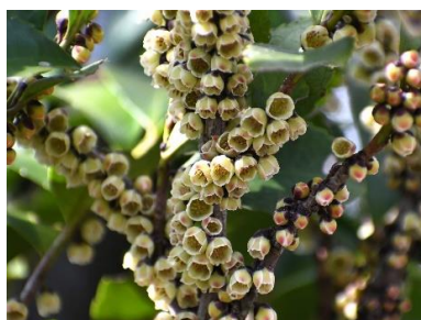
ヒサカキ(モッコク科)

雄しべと雌しべがある両性花と雄しべだけの雄花が1本の木の中にあります。もみじ谷にたくさん植栽されています。