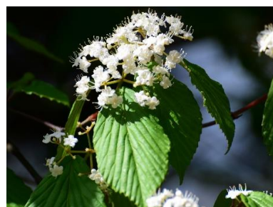
ガマズミ(ガマズミ科)

秋の紅葉が見事ですが、春は可憐な花を咲かせます。森の研修館前に植栽されています。