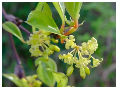
サルトリイバラ(サルトリイバラ科)

★印がついた種の生育場所は裏面地図をご覧ください。★印の無いものは園内に広く分布しています。