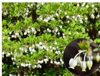
ドウダンツツジ(ツツジ科)★

当公園のコバノミツバツツジ群落は、令和5年に植物群落としては三木市初の市指定天然記念物に指定されました。例年初旬が見頃です。