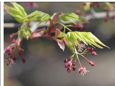
イロハモミジ(ムクロジ科)★

花の形を、武将が戦の時に持つ采配(さいはい)に見立てて采振木(さいふりま)と呼ばれます。