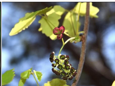
ミツバアケビ(アケビ科)

茎に鋭いトゲを持つツル性植物で、薄黄緑色の小さな花が咲きます。サンキライとも呼ばれます。