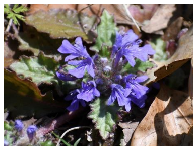
キランソウ(シソ科)★

園内でよく目にするスミレの一つです。葉裏が紫色なので「紫背(しはい)」スミレと名付けられました。