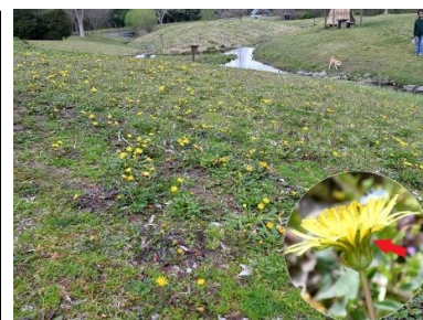
カンサイタンポポ(キク科)

花の形が、サギが飛んでいるようで、コケのように広がって生育することが名前の由来です。別名はムラサキサギゴケですが花が白色のものもあります。